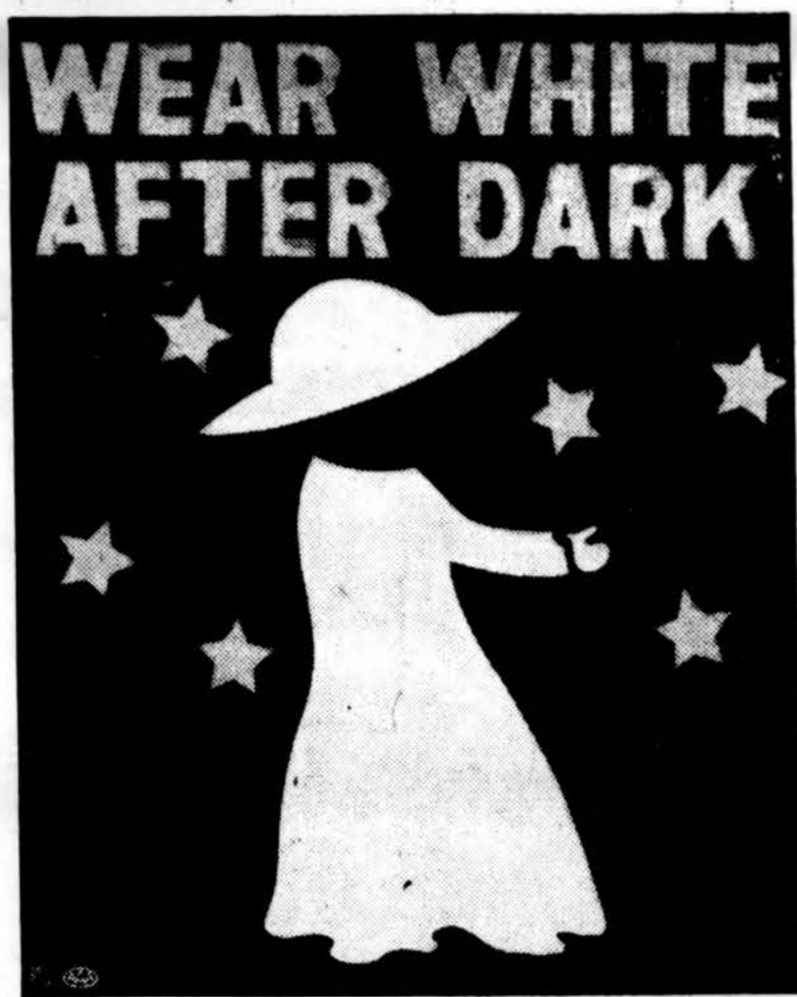
Always wear something white when walking after dark. If you do not have on light colored clothing, tie a handkerchief around your arm. Under most nighttime conditions, it is difficult for a motorist to spot a pedestrian crossing an intersection. This is the message contained in the Chicago Motor Club's monthly safety poster, which has been distributed to more than 44,000 elementary school classrooms throughout the Motor Club's Illinois and Indiana territory.