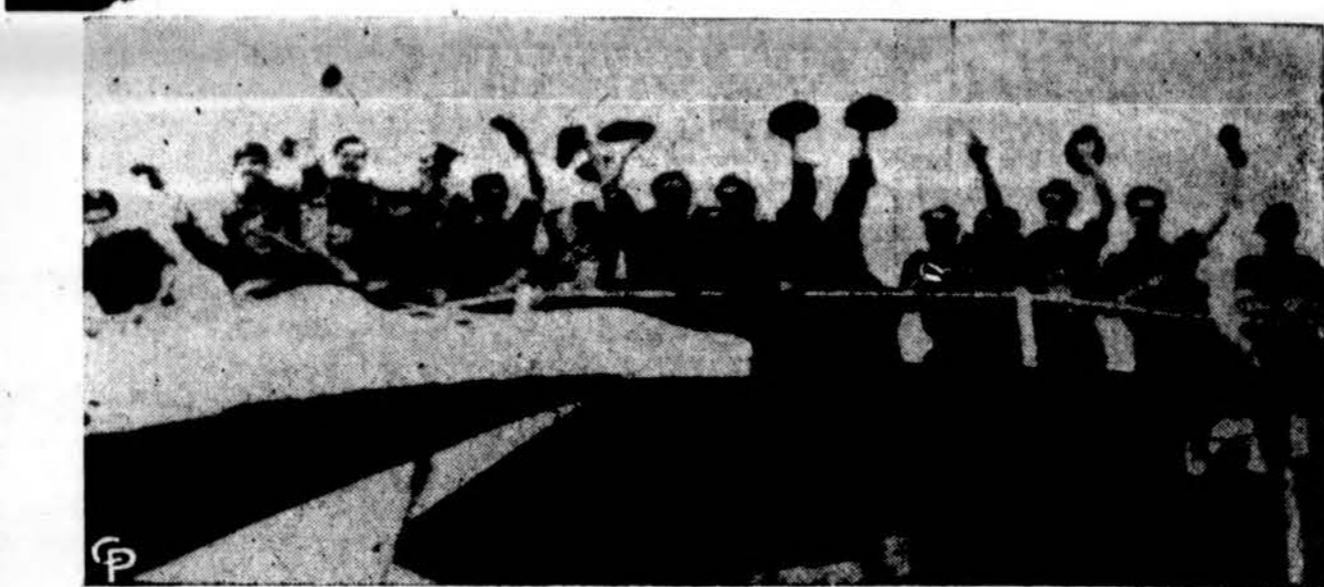
Britų kariai džiaugiasi palikdami Port Said, jie tikisi per Kalėdas būti namie. Pagal Jungtinių Tautų rezoliuciją pranešų ir anglų karo jėgos turi būti atitrauktos iš Egipto.