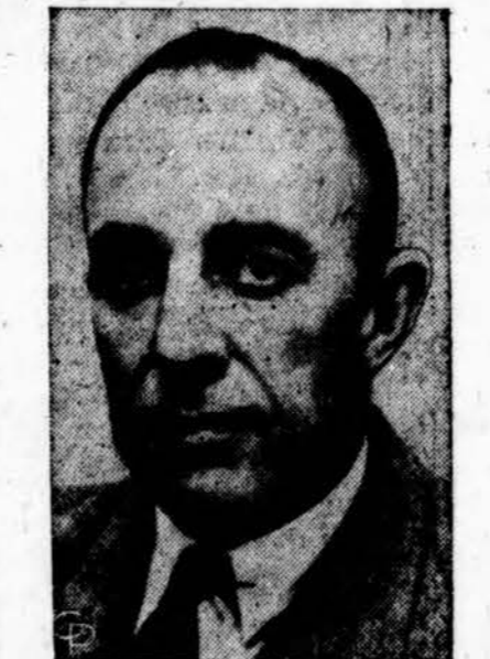
Douglas MacArthur II, naujas JAV ambasadorius Japonijai. Jis yra gimnastikos karo vado Douglas MacArthur.

Darbo partija smarkiai puolė Edeno vyriausybę. Atostogaujantį premjerą Edeną dabar pavaduoja Butleris.