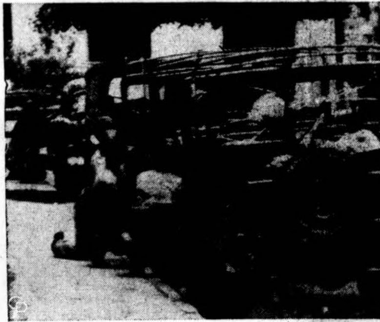
Kubos armijos sargybiniai pasislėpė už karinio vežimo, kai sukiličiai juos apšaudė iš pastatų. Strėlė rodo kulokos skvė karinio vežimo lange. Kuboje sukiličiai dar nenumalšinti.

Sovietų „raudonosios imperijos“ pakraščiais dar vis pasitaisko, kad užpildinėjami ne tik pa-