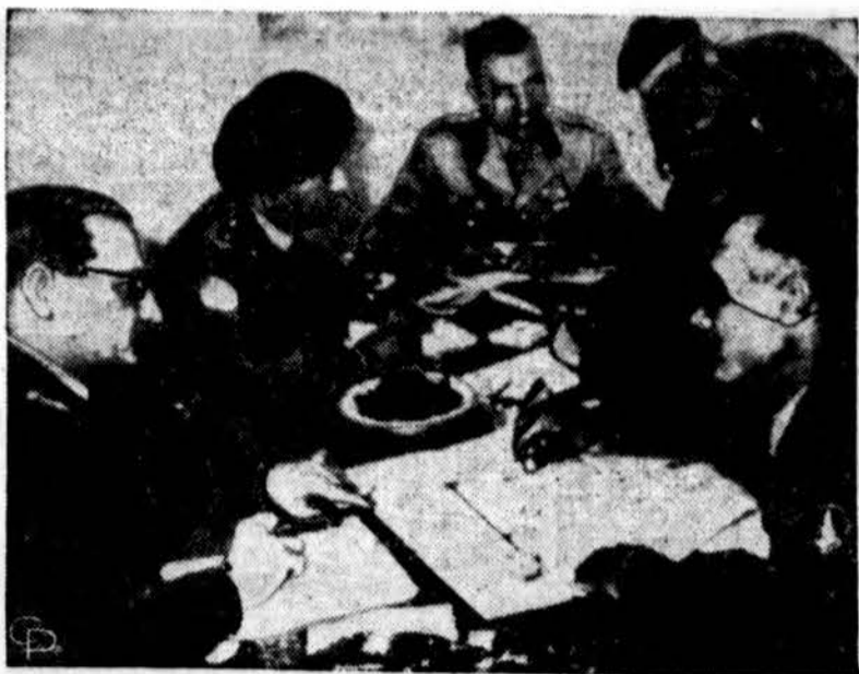
Maj. gen. Burns, Jungtinių Tautų Šešas Suez, kalbasi dėl Izraelio armijos atšitruaikimo su Izraelio karo jėgų viršininku maj. gen. Dayan.