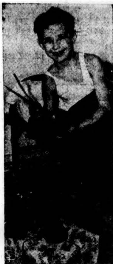
Vengrijos pabėgėlis Čamp Kilmer, N. J., džiaugiasi Sv. Mikalojaus dieną radęs rytą savo batukuose saldainių. Vengrijoje Sv. Mikalojaus šventė yra tradicinė dovany dalinimo diena.