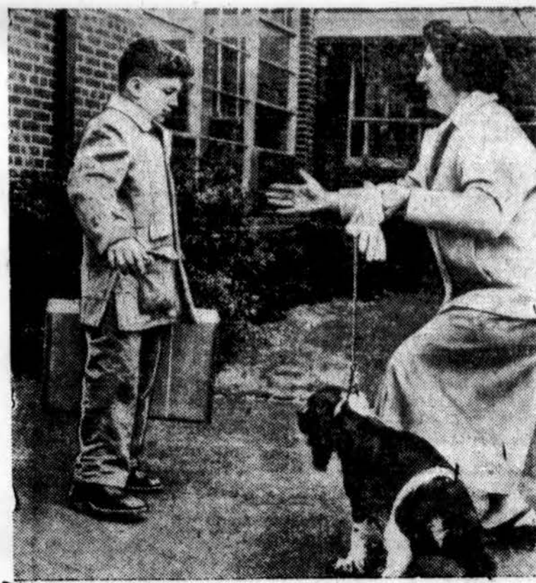
Berninkas 10 m., kuris prarado abi kojas automobilio katastrofoje, žengia pirmą kartą su dirbtinėmis kojomis Kesslerio Institute, West Orange, N. J.