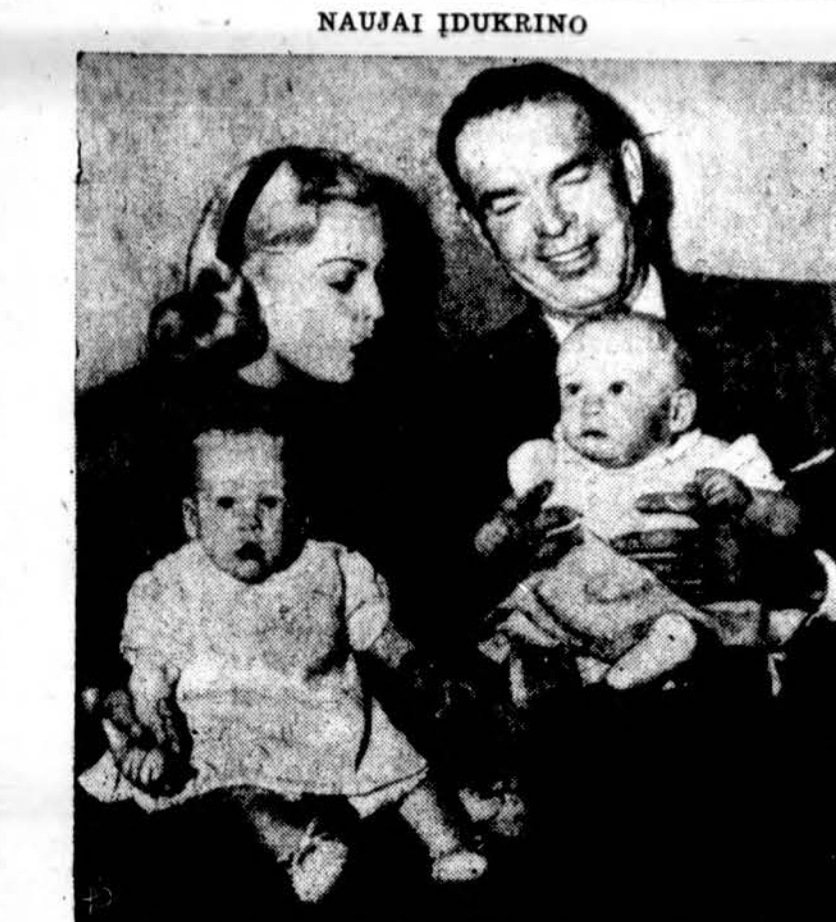
Aktorė June Haver ir vyras MacMurray, Santa Monica, Calif., laimingi žiūri į naujai įdukrintas mergaites. Pora turi dukterį 16 m. ir sūnų 12 m.

Jau laikas užsisakyti Kalėdines sveikinimų korteles. DRAUGAS tuojau Jums pristatys gražiausias kalėdines korteles su atininkais lietuviškais sveikinimais. Nesivilkite užsisakyti, nes kortelės suminčiamos ketvirtos klasės paštu, todėl kelionėje užtrunka iki 2 savaitių. Sveikinkite savo prietelius lietuviškoms kortelėms ir jas pirkite DRAUGE. Užsakymus su pinigais siųskite šio adresu: "DRAUGAS" 2334 So. Oakley Ave. CHICAGO 8, ILL.