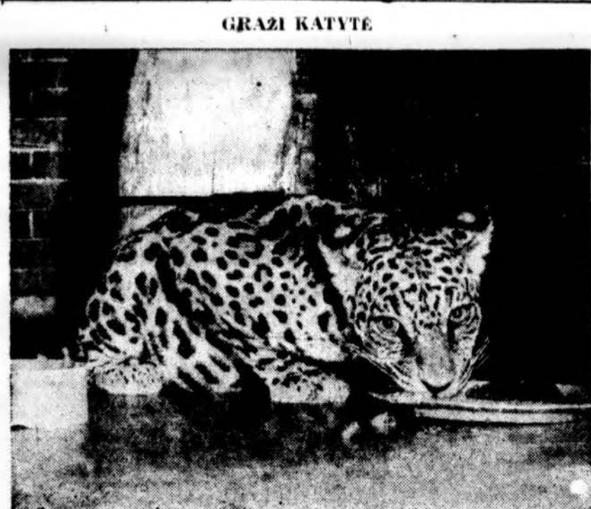
Sausio mėn. žvėrelių Chicago Lincoln Park zoologijos sode parinkta jaunas jaguaras, kuris iš Pietų Amerikos atgabentas praėjusio mėnesį.