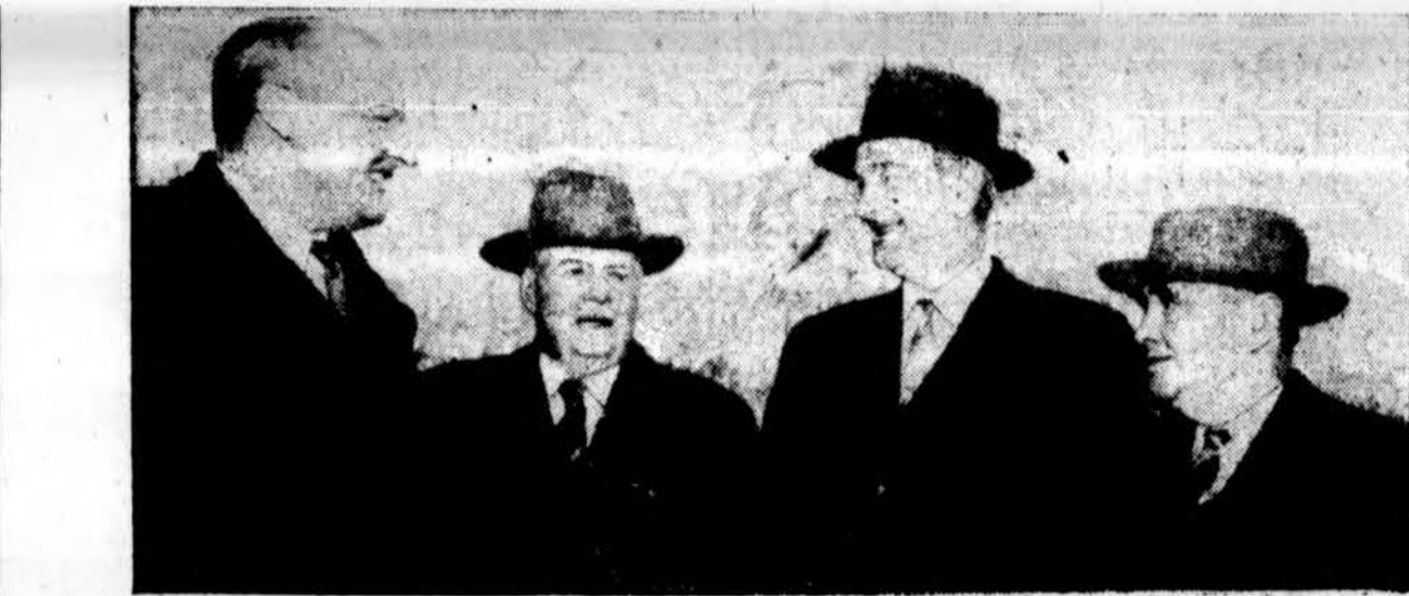
Kongreso lyderiai lankėsi Baltuose rūmuose pasitarti su prez. Eisenhower dėl Vidurinių rytų apsaugos plano. Iš k. į deš. sen. W. Knowland, Sam Rayburn, demokratų lyderis Johnson ir Joseph Martin

Pasaulinės valdžios pareiga y-ra rūpintis savo visuomenės šio gyvenimo gerove. Tos gerovės ji turi siekti dabar gyvenan-tiems žmonėms. Čia pasaulinės valdžios uždaviniai skirias nuo gimdytojų ir nuo privačių orga-nizacijų iniciatyvos. Anie dažnai per savo vargą siekia gero tik būsimoms kartoms. Tokios kryp-ties iniciatyvą skatinti, net ir paremti tinka ir pasaulinei val-džiai, tačiau ji negali pirmesti savo laiko žmonėms skurdą tuo pagrindu, kad per tai būtų sie-kiama ateities kartų gerovės. Katalikų atstovaujama pažiūra į valstybę ir jos valdžios parei-gas skaito išskrypimu tokią ten-denciją, kurią skelbia ir vykdo bolševikai: — už dabar gyve-nančių žmonių vergiją ir skur-dą žadėti aukso kalnus už ši-mto metų. Kas nemoka dabarti-no gyvenimo tvarkyti, tas ir ateitį paliks tik skurdą ir griu-velius. Šio laiko valdžios parei-