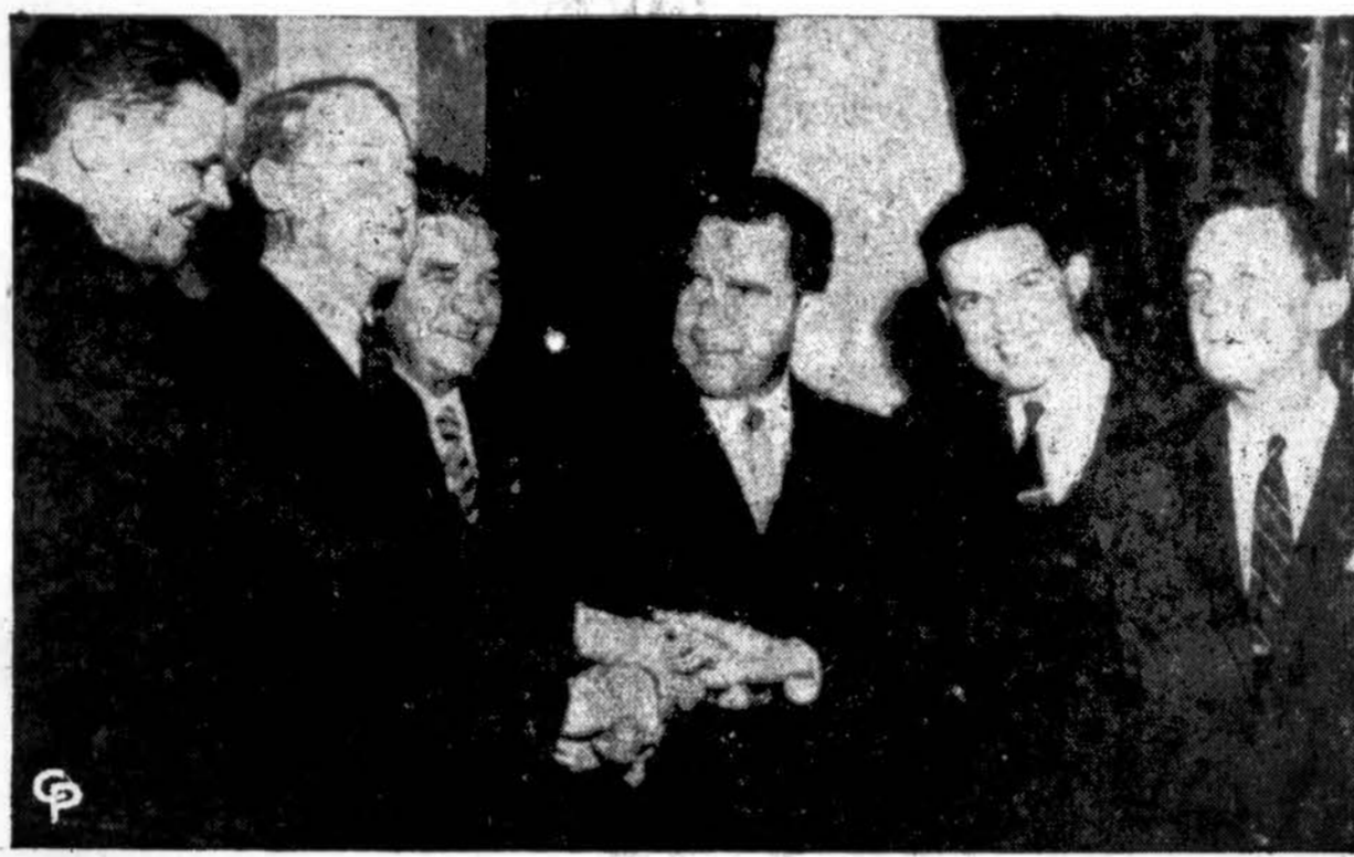
Viceprezidentas Richard Nixon sveikinasi su naujais senato nariais. Grupėje su viceprezidentu (iš kairės ir dešinės) yra sen. Thurston Morton (R., Ky.), sen. John S. Cooper (R., Ky.), sen. Frank J. Lausche (D., Ohio), sen. Frank Church (D., Idaho) ir sen. Joseph S. Clark (D., Pa.)

Oro biuras praneša: Chicagoje ir jos apylinkėse šiandien — šilčiau.