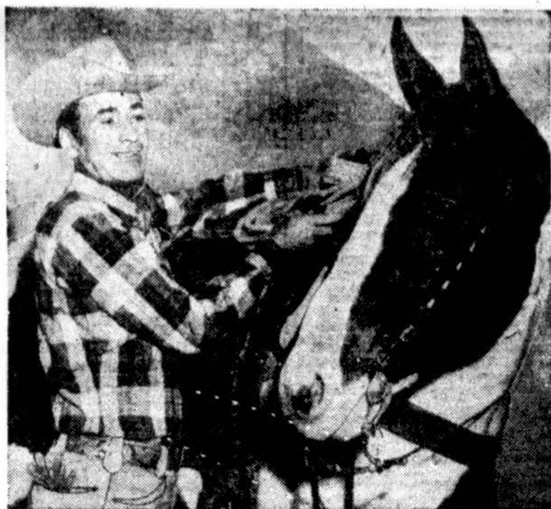
Montie Montana and his horse Rex at home in Northridge, Calif.