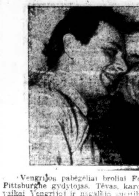
Vengrijos pabėgėliai broliai Fodor susitiko savo tėva, kurie yra Pittsburghe gydytojas. Tėvas, karo metu buvo palikęs Anglijoje, g. vaikai Vengrijoje ir negalėjo susitikti istia 17 m. (INS)

serga ar pasmerkti mirt". Sio laiško ištrauka yra iš kol-hoze dirbančios 23 m. mergai-tės. Rašyta pat. isyla.