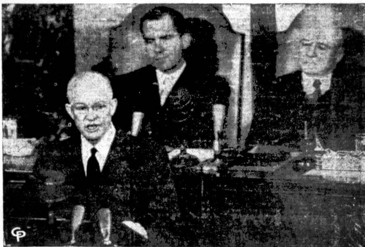
Viceprezidentas Nixon ir pirmininkas Rayburn klauso prez. Eisenhowerio kalbos, kurioj pabrėžė, kad ekonominis JAV gyvenimas gerėja, tačiau priminė ir infliacijos pavojų.

darbą Balso veikloje ir stengėsi sudaryti tokias sąlygas, kad jis ir toliau iš Balso veiklos nepasitrauktų.