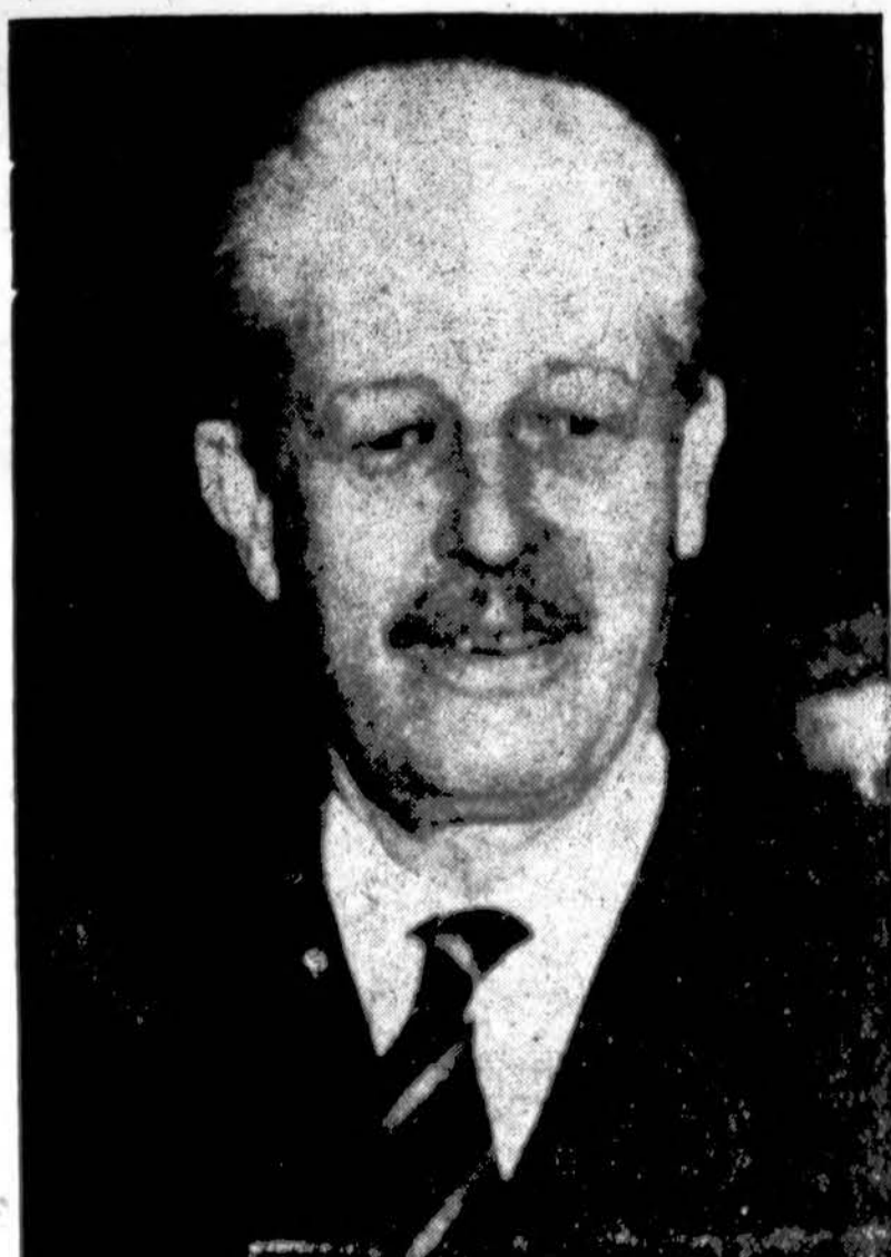
Harold Macmillan, naujas Britanijos ministras pirmininkas. Jis yra 43-iasis premjeras nuo 1721 metų, kai buvo sudarytas Britanijos premjero ofisas.

Oro biuras praneša: Chicagoje ir jos apylinkėje šiandien apsiniauks ir šalta; rytoj — daugiau sia apsiniauks ir šalta.