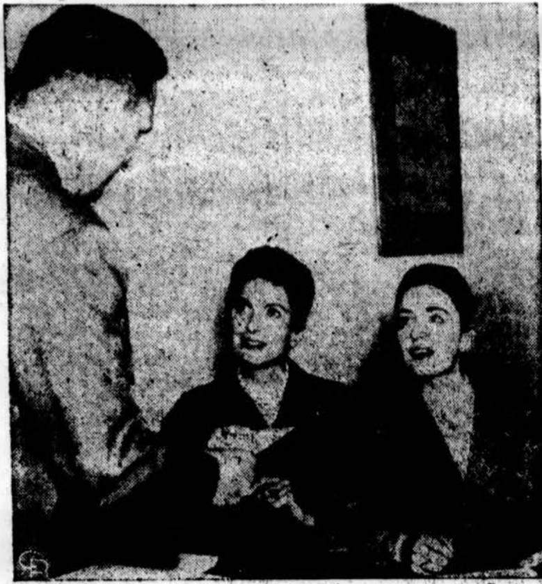
Skotė ir italė, neturinčios JAV pilietybės, jau užsiregistravo Los Angeles, suteikdamos savo adresus imigracijos direktoriui. Visi neturinčios pilietybės turi užsiregistruoti iki šio mėn. 31 d. Tai galima padaryti vietos paštuose. (INS)

liu tokius mokesčių mokėtojus bei rinkėjus, kokiais liepia būti krikščionybės mokslas, ir pasakui tedersta sakyti ją esant žalinga valstybei. Juo labiau po 17 šimtmečių krikščionims dera su prasti ir savo pavyzdžiu parodyti, koks turi būti valstybės pilietis. Galime pasididžiuoti, kad apie gerus katalikus dabar galime pakartoti anuos Tertulijono žodžius. Kai šalia savęs matome nesąžiningą ar nesąmoningą pilietį, jam nepavydėkime ir juo nesekime, o tik pasistenkime patys tokius nebūti ir aną geres-