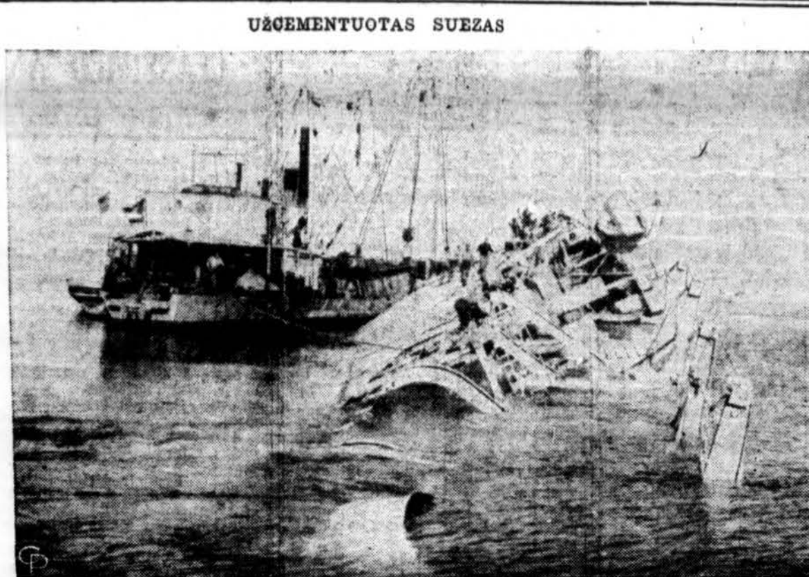
Egipto laivas Aka, 5,000 tonų dydžio, guli kanale nutrauktas 2,000 tonų cemento krovinio. Laivas bus išsprogindintas dinamitu ir ištrauktas gabalais. Laiva nuskaudino angly-pranešųj lėktuvas. (INS)