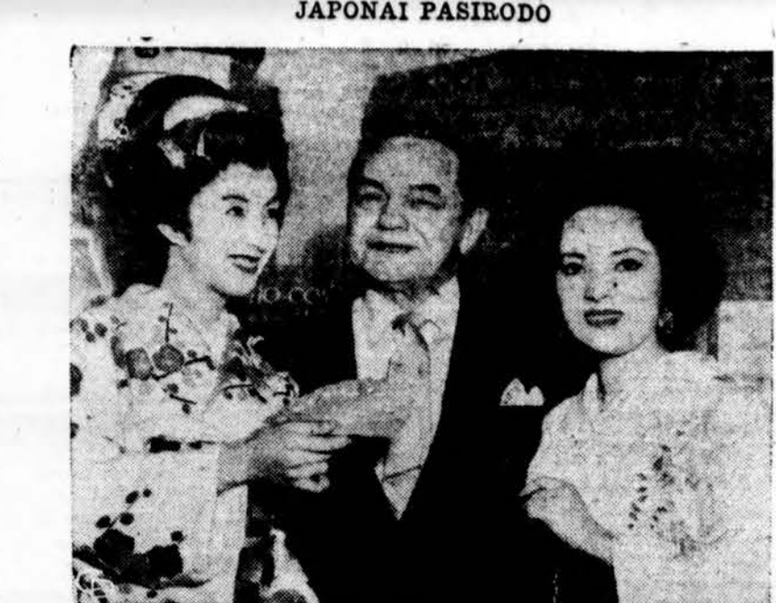
Japonų filmų savaitė vyksta New Yorke. Matome Japonijos filmų žvaigždes.