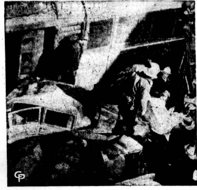
San Francisco mieste ugniagesiai ištraukia moters kūną iš degančio automobilio. Kiti du asmenys buvo sužeisti, kai tramvajus užklidė du automobiliai.