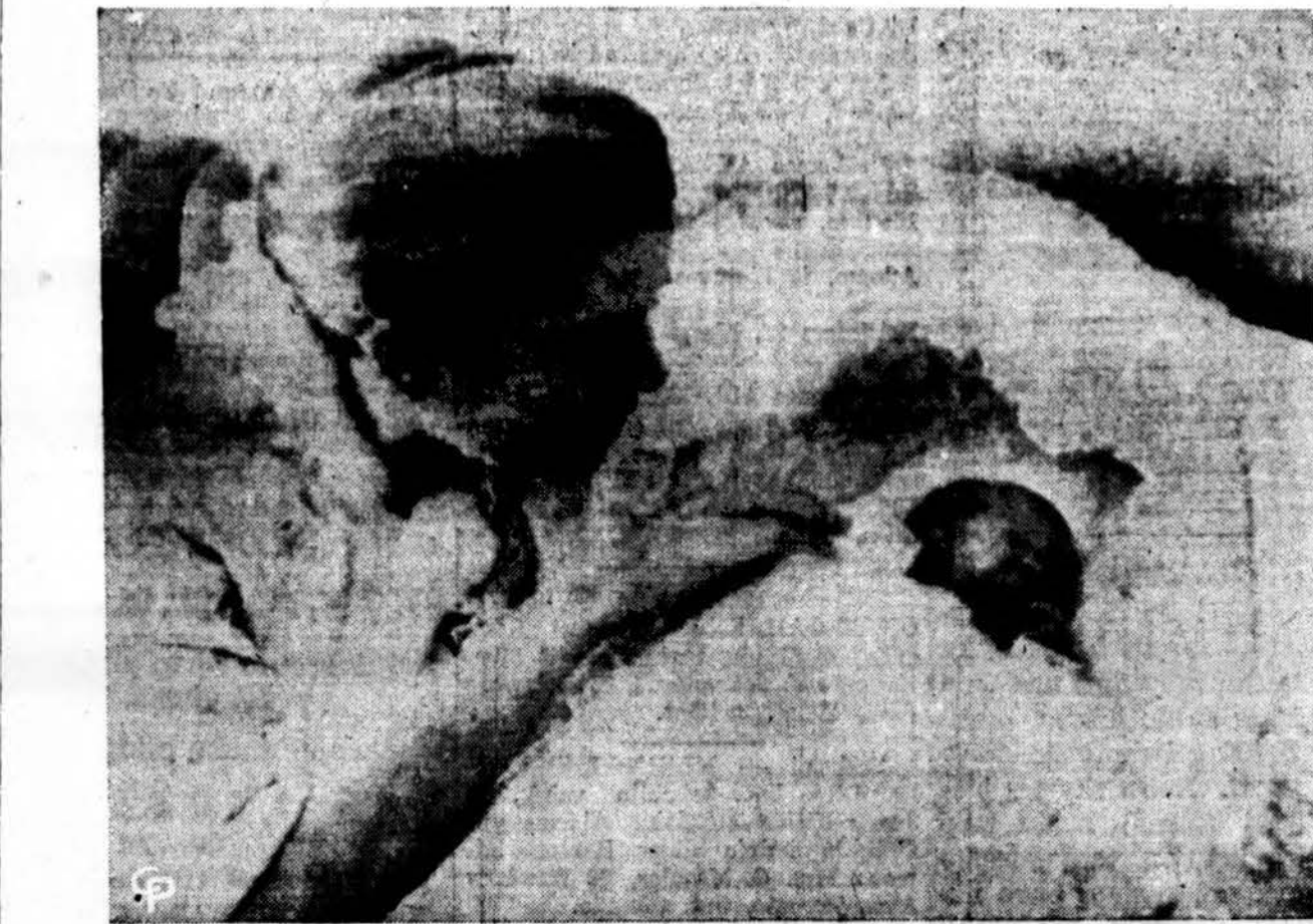
Monaco princo dukte Carolina Louise Marguerite pozuoja pirmą kartą fotografui.