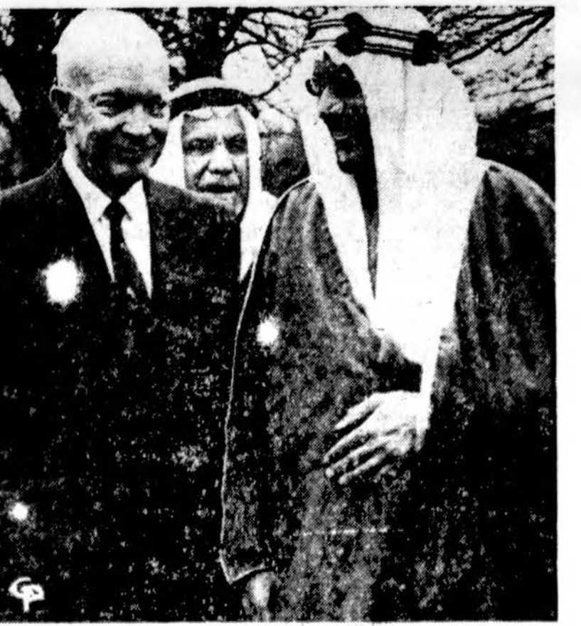
Karalius Saud atsisveikina su prezidentu Eisenhower išvykdamas namo.