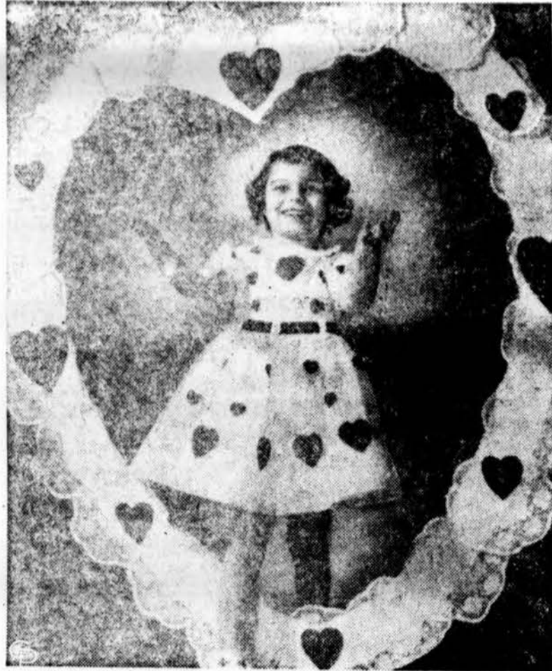
Šv. Valentino diena džiaugiasi ir ši maža sinjorita. Ji yra viena iš išrinktų propaguoti širdies Fondui, širdies ligų gydymui.

niečiams ne kristų į akis jų niekėngas darbas, kas kenktų užsienyje bolševikinei propagan dai.