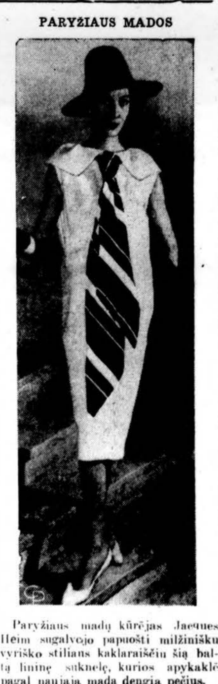
Paryžiaus modų kūrėjas Jacques Heim sugalvojo papuošti milžinišku vyrisko stiliaus kaklaraiščiu šią balta lininę suknelę, kurios apykaklę pagal naująją madą dengia pečius.