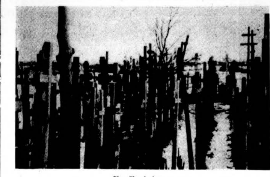
Kryžių kalnas Nauja nuotrauka, gauta iš Lietuvos