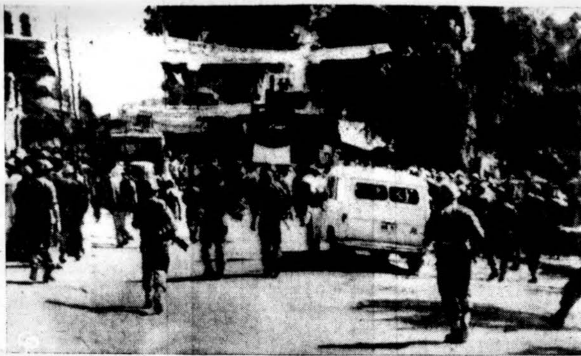
Gazoj Jungtinių Tautų būstinė yra saugojama Danų karių nuo demonstrantų arabų, kurie nori iškelti Egipto vėliavą viršum. J. Tautų būstinės. Demonstrantai buvo išblaškyti ašarinių dujom.

Be to, kaip žinome, lokys neseniai maloniū balseliu kalbėjo ir Vakarų Vokietijos vyriausybei Bonnoje. Bulganas neseniai siūlė Bonnai „pelningą“ prekybą sutartį su Maskva; tuo pačiu Bulgano nurodo buvo visiškai nesibaramą už glaudžius santykius su Vakarais, už priklausymą NATO šeimai ir t.t. Tiesa, notoje buvo užsiminta apie tai, bet „labai gražioje formoje“. Esą Vokietijos žmonės savo „prigimtiniū genialiu ir pla-