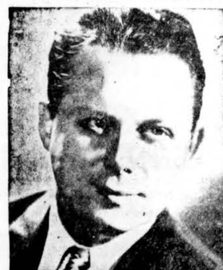
ALGIRDAS BRAZIS, Rigoletto