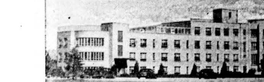
Vienas iš dviejų Spears Chiropractic Hospital pastatų veikiančių dabar. Kada jau trečias pastatas bus užbaigtas, (dabar eina jo statyba), Spears turės apie 3000 lovų.

Dabar yra ruošiami pranešimai apie mūsų naujus tyrinėjimus duodančius patenkinančius rezultatus gydant tuberkulozą, nuomara, raumenų distrofiją, galvos skaudėjimą ir kitus problematiskus negalavimus. Nors šitas straipsnis ypatingai liečia arthritą ir rheumatizmą, kviečiame rašyti mums dėl nemokamų informacijų apie didelį palengvinimą teikian-