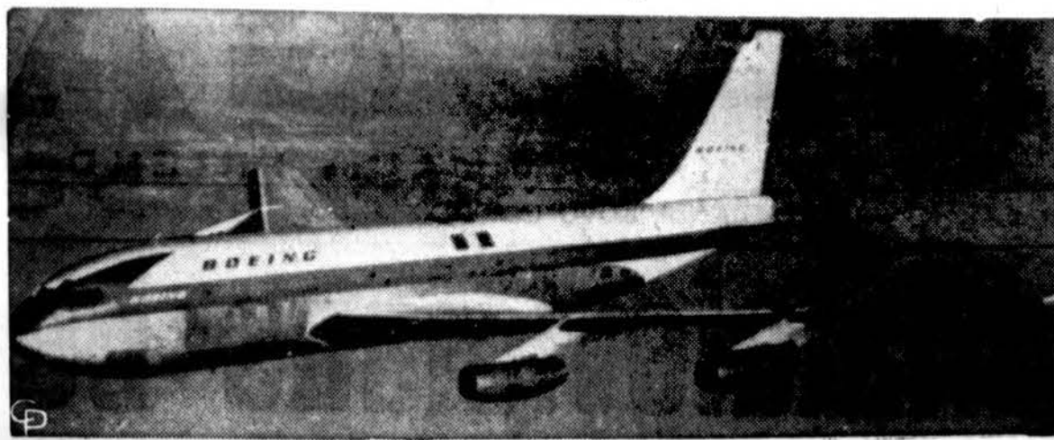
Neseniai išbandytas sprausminis komercinis lėktuvas Boeing 707 bus pradėtas vartoti nuolatiniams susisiekimui 1959 m.