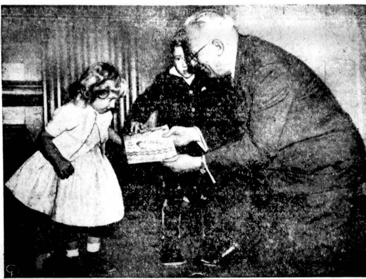
Teisingumo sekretorius Warren, garbės pirmininkas Columbijos Invalidų Vaikų draugijos, priima specialius pardavimo ženklus išleistus Velykų progą. Jie parduodami, kad būtų gautama pelno invaidams vaikams šelpti.