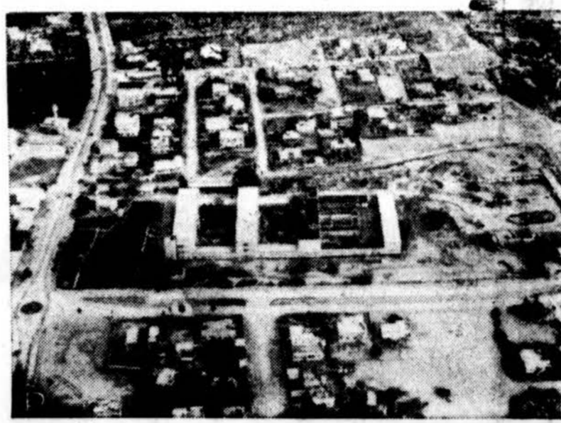
Čia yra Gazos policijos ir miesto savivaldybės rūmai. (viduryje), kuriuos Jungtinių Tautų kariai naudoja savo įstaigoms. Pranešama, kad Jungtinių Tautų pajėgos greitai pasitrauks iš Gazos ruožo.