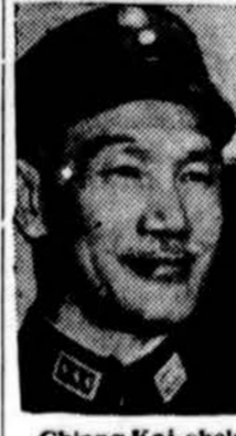
Chiang Kai-shek Nacionalinės Kinijos prezidentas Chiang Kai-shek stiprina savo karines pajėgas prieš galimą komunistinę agresiją.

Bendroji Europos rinka ir atominės energijos bendruomenė bus ratifikuota kovo mėn. pabaigoje turbit Romoje.