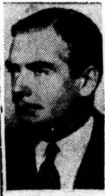
Anthony Eden Buvęs Britanijos premjeras Eden sveiksta Naujoje Zelandijoje.

● Izraelio premjeras Ben-Gurion spėja, kad kitas Arabų — Izraelio karas yra galimas kelių mėnesių laikotarpyje.