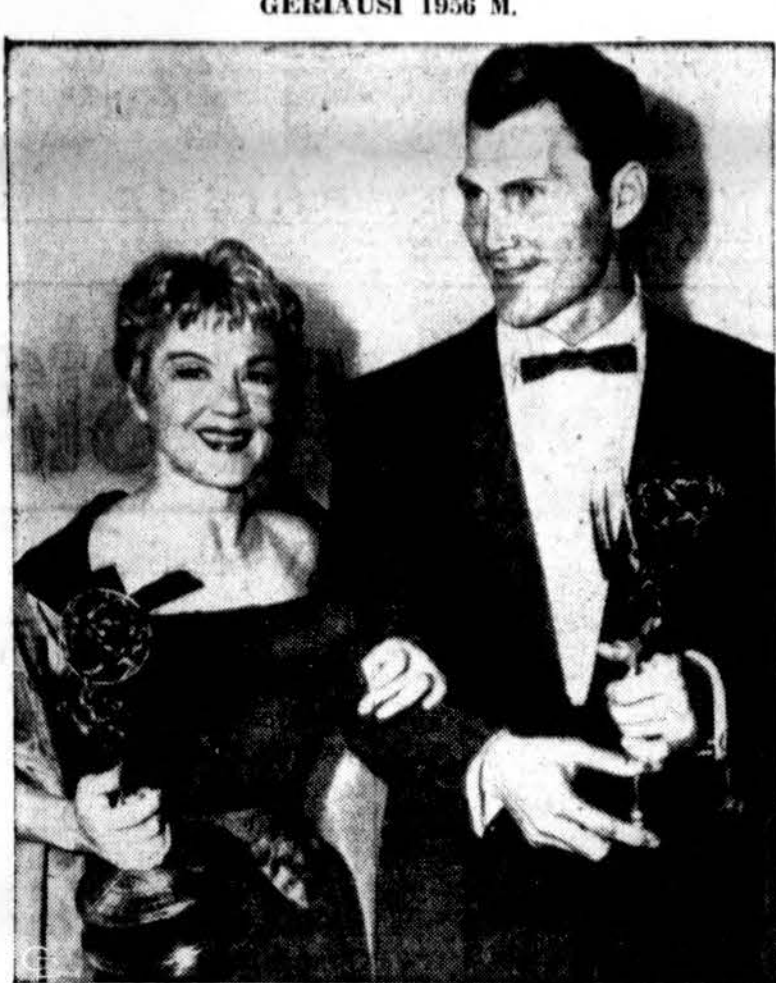
Claire Trevor ir Jack Palance susitikinė rankomis džiaugiasi, kad jie buvo išrinkti geriausias televizijos artistais 1956 m. Jis laimėjo premiją už vaidmenį filmoje "Dod-worth" ir jis už vaidmenį filmoje "Requiem for a Heavyweight".

Kas laimės? Reikia tikėtis, jog kiekvienas pirmenybių dalyvis atsiveža ne tik norą laimėti, bet taip pat ir pažangą, padarytą žiemos metu. Ypatingai džiugu, jog mūsų jaunių meistris, savo tarpe turėdamas visą eilę iškilų žaidėjų, turėtų suteikti progą Detroito visuomeni pasigrožėti mūsų krepšinio prieaugliu.