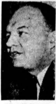
Harold Stassen Harold Stassen atstovauja Jungtines Amerikos Valstybes Londono konferencijoje, kurioje svarstomi nusiginklavimo klausimai.