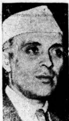
Jawaharlal Nehru Indijos premjeras Nehru prašo padidinti krašto apsaugos fondus.

● Egipto prezidentas Nasseris sutinkas padaryti kaikurių nuolaidų Suez kanale.