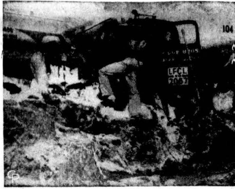
Sniegas sumaišytas su rudomis dulkėmis sulaukė sunkvežimį netoli Limon, Colorado. Sniegas ir dulkės atėjo nuo Rocky Mountains, nešami 80 mylių vėjo.