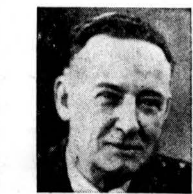
Gen. Thomas D. White paskirtas JAV oro pajėgų štabo viršininku; buvo štabo viceviršininku.