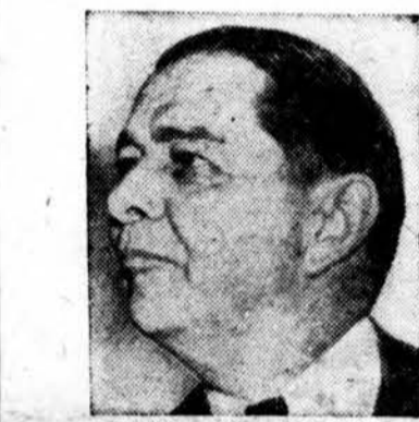
James H. Douglas yra pakeltas į JAV oro pajėgų sekretoriaus postą iš vicesekretoriaus.