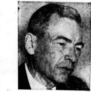
Donald A. Quarles paskirtas JAV apsaugos vicesekretoriumi; buvo JAV oro pajėgų sekretoriumi.