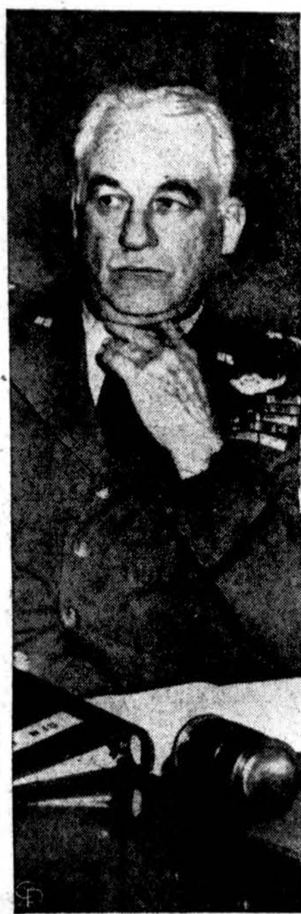
Gen. Nathan F. Twining paskirtas JAV štabų viršininku tarybos pirmininku; buvo oro pajėgų vadovas.

Kovo 29 d.: šv. Jonas Barakizjus, kan.; lietuviški: Eikis ir Gygoja. Kovo 30 d.: šv. Agnietė; lietuviški: Daniulis ir Siutė. Saulė teka 5:39, leidžiasi 6:13. ORAS Oro biuras praneša: Chicagoje ir jos apylinkėse šiandien — šilčiau.