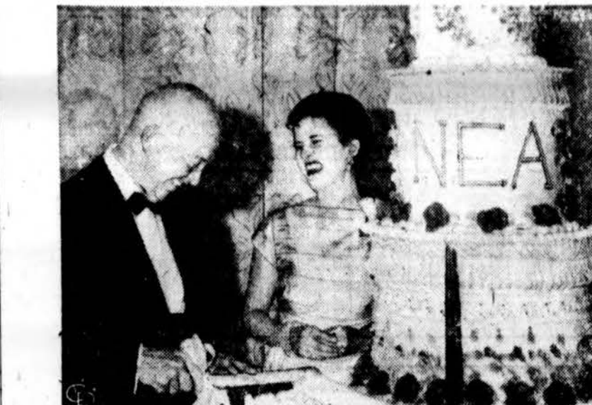
Prez. Eisenhower pjauna tortą National Education draugi- jos 100 m. sukaktuviniame bankete Washington. Šalia stovi tos drau- gijos pirmininkė.