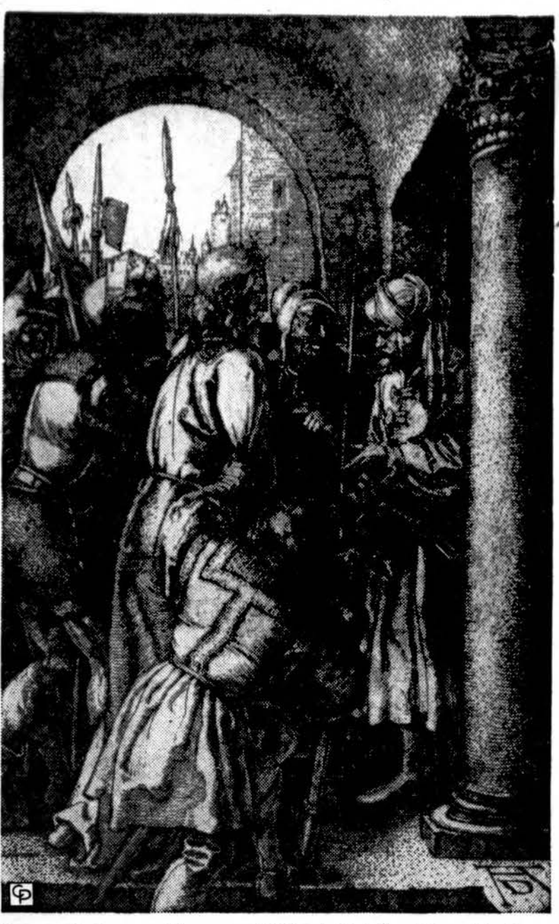
Šis paveikslas yra žinomo vokiečių dailininko Albrechto Duererio raizūnas, Toledo meno muzėjaus nuosavybė. Pilotas Jį klausė: "Ar Tu esi žydų karalius?" Jis atsakydamas jam tarė: "Tu tai sakai". Tuomet vyriausieji kunigai kaltino Jį daugeliu dalykų. (Sv. Morkus 15, 2-3)