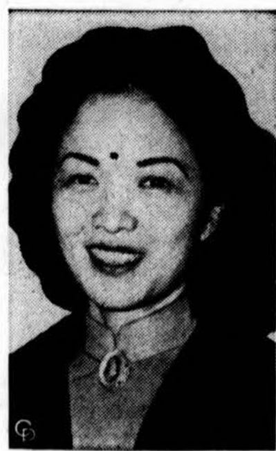
Mme. Ngo Dinh Nhu, 32 metų, Vietnamo respublikos pirmoji moteris, tris savaites svečiavosi Jungtinės Amerikos Valstybėse. Ji yra noli kovotoja prieš komunizmą. Jai teko sėdėti komunistų kalėjime. Mme Ngo Dinh Nhu yra Vietnamo prezidento brolio žmona. Kadangi Vietnamo prezidentas nevedęs, tai Ngo Dinh Nhu atstovauja pirmąją moterį krašte.

Oro biuras praneša: Chicagoje ir jos apylinkėse šiandien — švelni oro temperatūra.