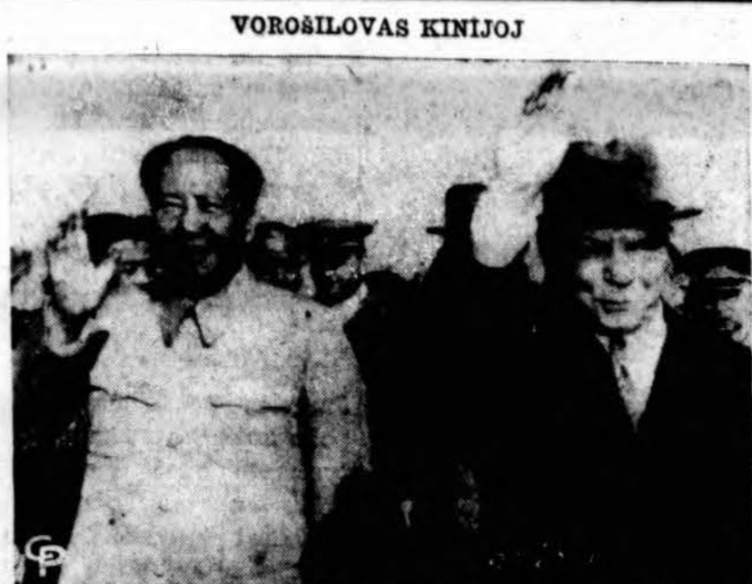
Vienas iš sovietinių eary, Vorosjilovas lankosi Kinijoje ir Peipingo aerodrome susitinka Kinijos raudonąjį bosą Mao Tse-Tung.

Didelis atsilikimas Šis žemės ūkio specialistas savo dviejų valandų paskaitoje Wisconsinio universitete pavyzdžiais ir nuotraukomis įrodė, kad sovietiško kolchozo darbininko šiandieninis gyvenimo lygis yra toks, koks buvo čia tolimos provincijos ūkininko 1880 metais. Vidutiniškai turtingas kolchozininkas gyvena su visa šeima dviejų ar keturių mažųjų kambarėlių namuke, kuris iš to visai panašus į vištinių, negu į trobas. Namų vidus pasibaisėtina skurdus, kai kur nėra nė lovų, žmonės nakty guli tiesiog ant grindų, pasidėję šiaudų maišus, kurie dienos metu stovi sustatyti kampuose arba lauko pusėje pakarti po pastogę. Labai dažnai nerasi virtuvės, ne krosnies, keptuvės ir verda tiesiog ant atviros ugnies, įtaisytos toje vietoje, kur susieina kampai visų namo kambarių ir primena mūsų salonų ugnivietę (ar, tiksliau sakant, mūšikės ugnivietės primena kolchozininkų virtuvę). Ši atvira ugnis žiemą apšildo ir namo kambarius. Niekur provincijos kol-