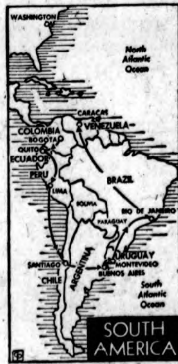
Zemėlapyje nurodoma JAV štabų viršininkų tarybos pirmininko admiralro Radfordo kelionės maršrutą Pietų Amerikoje. Kelionėje jis išbuvo nuo balandžio 28 iki gegužės 18 d.

BONNA, bal. 28. — Uždarė komunistines organizacijas. Saaro kraštą prijungus prie Vokietijos, ten tebeveikė komunistų partija. Dabar ji uždarė, kaip ir visoje Vakarų Vokietijoje.