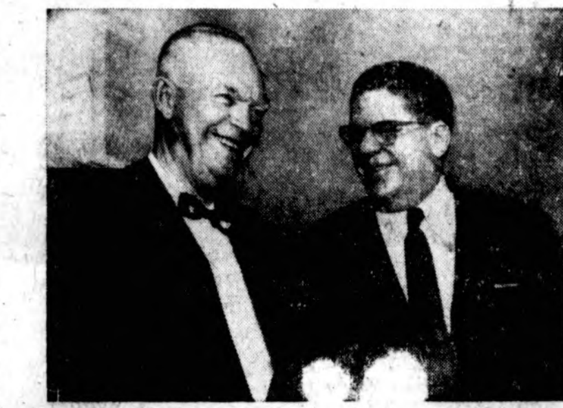
Prezidentas Eisenhoweris kalbasi su Darbo sekretorium James Mitchell. Mitchell buvo nuvykęs į Augustą, Ga., kur prezidentas atostogauja. Jis tarėsi apie projektuojamus įstatymus apsaugoti darbininkų unijų pinigus nuo išiekojimo.

Besistengdama iš atskirų sąjunginių respublikų išspausti ko daugiau naudos, Maskva Chruščėvo lūpomis paskelbė naują, kad ateityje apyvartos vietasasjunginis mokestis bus imamas jau pačioje gamybos vietoje, o ne paskirstymo vietovėse. Kitaip tariant, jei, pavyzdžiui, Lietuvos fabrikas pagamins prekę, einančią į kitas Sovietų Sąjungos sritis, tai apyvartos mokestį turės sumokėti Lietuvos fabrikas, ne paskirstymo punktu kur nors Rusijoje. Kai apyvartos mokestis didžiojoje eina visas sąjungininkas (kason atskiros respublikos gauna tik mažą dalį), tai to mokestio ėmimas Lietuvos gamyklose, sa-