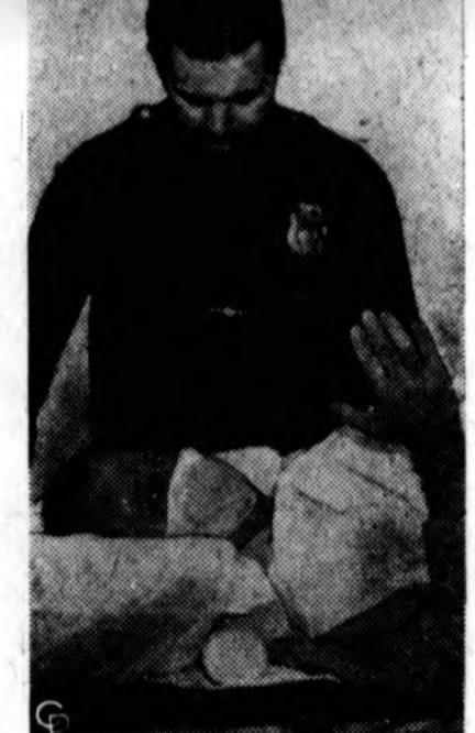
"Bombonešis" Metesky, kuris per 16 m. terorizavo New Yorko gyvenvietojus padėdinėdamas bombas, šiandien sunkiai serga džiova.

kelią, kurio 10 mylių kainuos $120,000,000. Pirmoji sekcija — tarp Congress-str. ir Randolph — būsianti baigta jau 1959 metais. Tas kelias jungsis su Edens ekspresiniu keliu ir su O'Hare aerodromu.