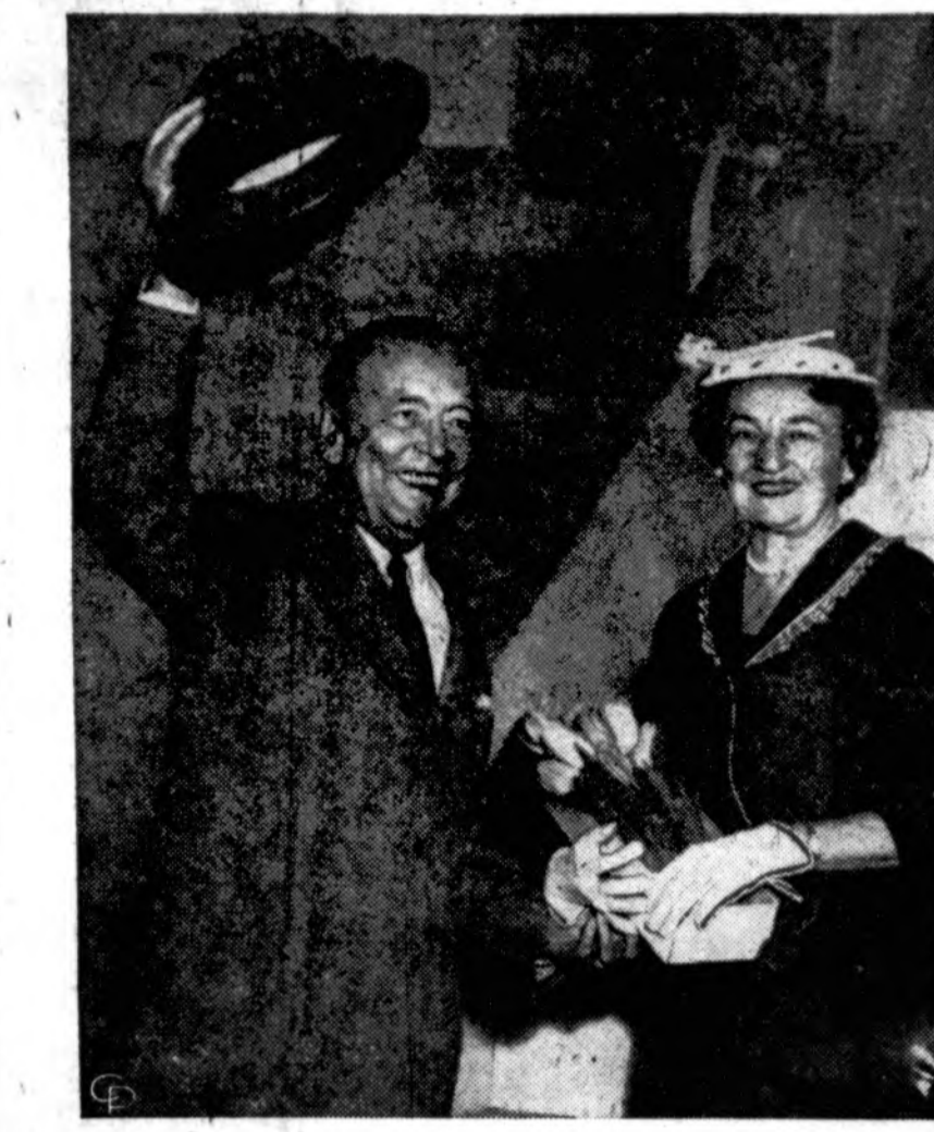
Arthur Radford, JAV Stabų viršininkų tarnybos pirmininkas, ir jo žmona išvyko į Pietų Ameriką, kur išbus iki gegužės 18 d.

Kūno transportacija iš Klebonijos į bažnyčią bus šį trečiadienį 4 val. p. p.