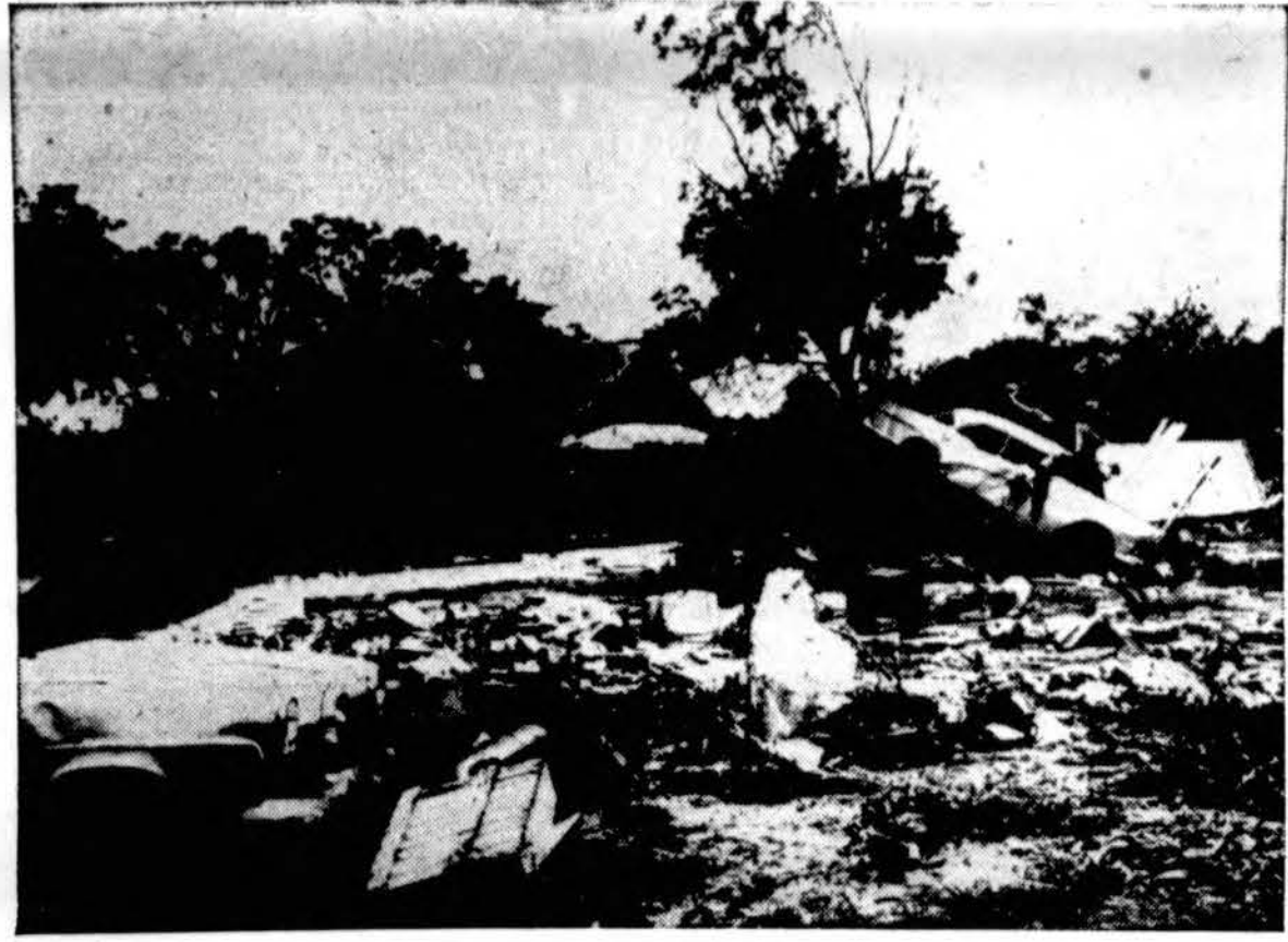
Taip atrodo vienas klemas Lampasas, Tex., praėjus potvyniui.

Šitie kalninimai nustebins, papiktins, nuliūdins ir netgi įžeis daugumą vakariečių. Vakariečiai olandai žino, kad jie išsikraustė iš Indonezijos, o vakariečiai anglai — kad jie savo ruožtu išsikraustė iš Indijos, Pakistano, Burmos ir Cello no jau 1945 m. Be to vakariečiai anglai neturi nei savo sąžinės agresijos karų, neskaityt 1899 — 1902 m. būrų karo, ir vakariečiai amerikiečiai taip pat, neskaityt su ispanais 1898 m. Mes visi lengvai užmirštame, kad vo-