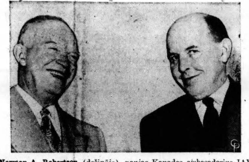
Norman A. Robertson (dešinėje), naujas Kanados ambasadorius JAV, įteikė savo kredoencijus prezidentui Eisenhoweriui Baltuose Rūmuose.

GRANADA, Ispanija, geg. 20. — Gen. Francisco Franco vakar dalyvavo ketvirtuoju tautinio Eucharistinio kongreso iškilmių uždaryme. Keturių dienų kongrese dalyvavo per 100,000 asmenų.