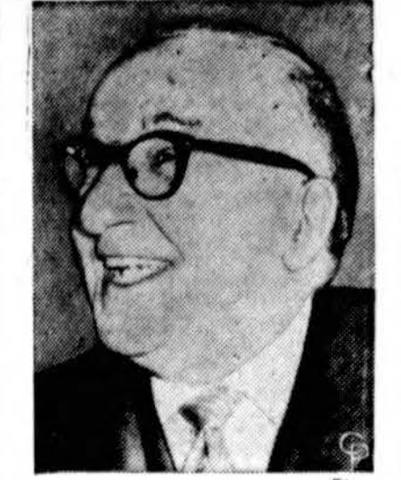
Adine Zoli, naujas Italijos ministras pirmininkas.

Chruščevio reforma nepagydyta „Savo poelgiuose darbo žmonių klasės atžvilgiu — rašo toliau dienraštis — biurokratai pasilikę biurokratais. Tik tai jie bus kitaip paskirstyti plačios imperijos plote...“ „Būdamas biurokratijos reforma bendriems biurokratijos, kaip klasės, interesams apsaugoti, Chruščevio reforma nepagydyta jokios pagrindinės Stalino sukurtos režimos ydos“.