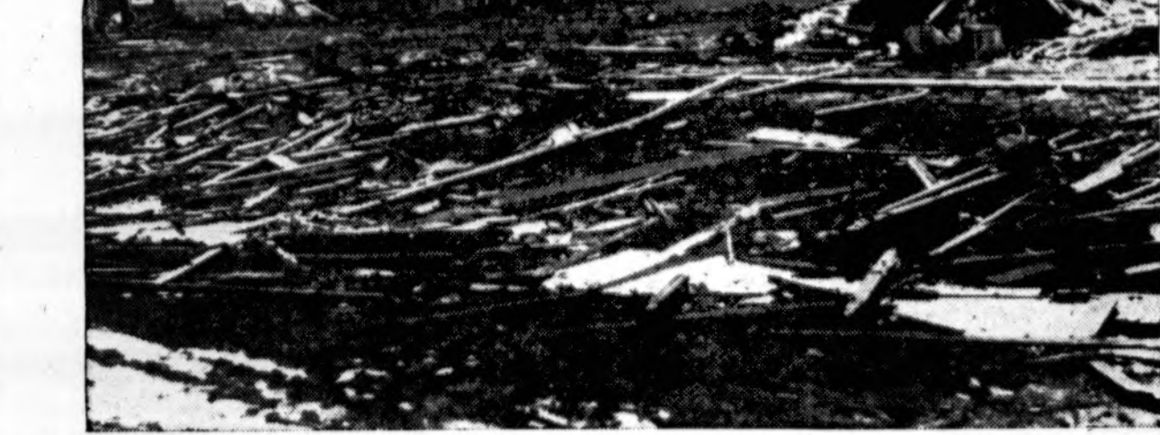
Dvidešimt asmenų užmušta ir 70 sužeista nusiautus tornado Texas valstybėje. Čia matome vieną vietą Silverton mieste.

Si žemės reforma yra gražus įrodymas mūsų ūkinės išminties ir kituose kraštuose.