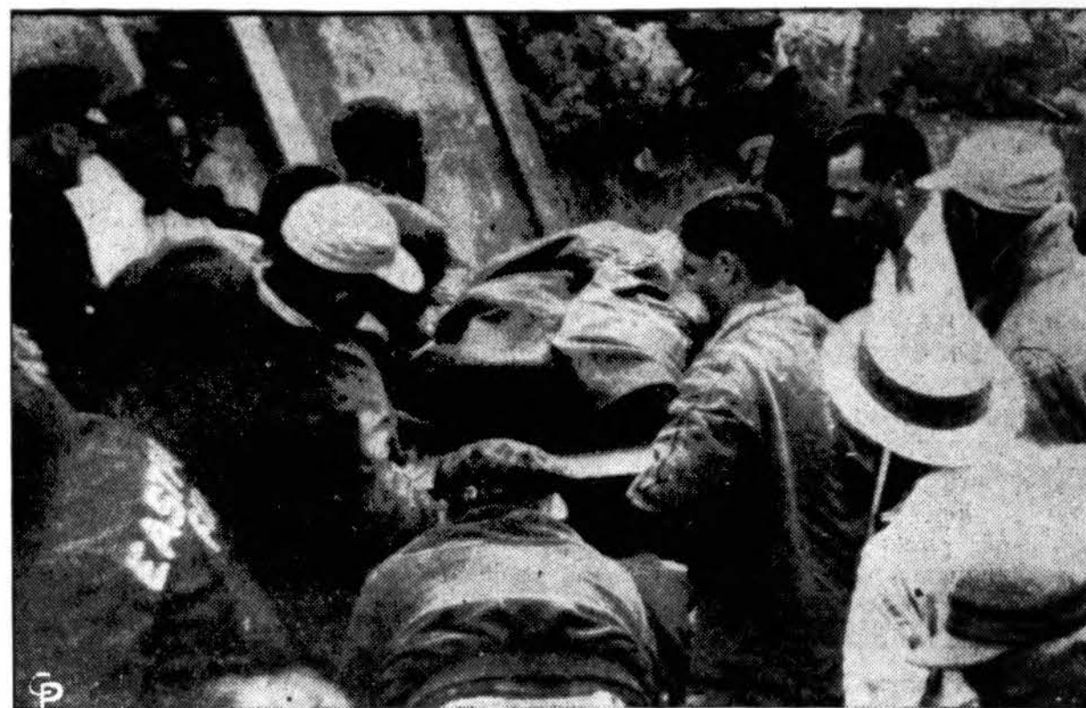
Visą Ameriką sujudinęs ir sukrėtęs berniuko įkritimas į vienos pėdos skersmens ir 24 pėdų gylumo šulinį baigėsi laimingai. Čia jį matome iškeliamą iš šulinio gyvą, po 24 val. (INS)

Pagaliau, norint jiems būtinai pasilikti ištikimais jų Lietuvoj išbandyti sistemai, tautininkų vadai galėtų ir ateity kar toti, kad jiems Lietuvoje tikrai rūpėjęs demokratijos įvedimas, bet jų garbinamasis "tautos vadas" per neapsižiūrėjimą savo politinėj praktikoj per daug sekęs tuometinius Italijos ir Vokietijos vadus ir vien tik dėl to jų Lietuvoje sukurta "praktinė santvarka valstybėje" nevisai tiesiai vedusi lietuvių tautą į de