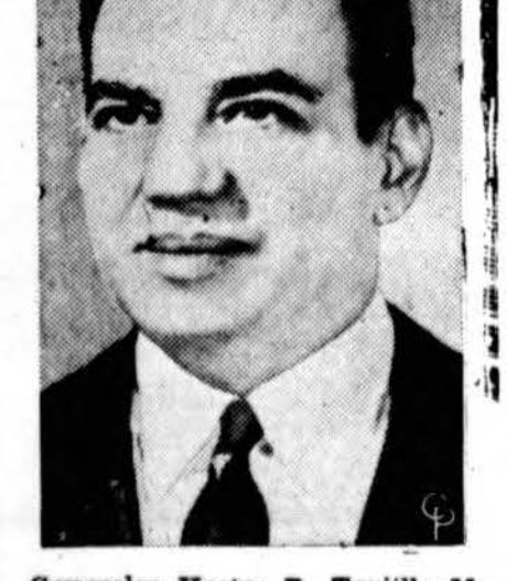
Generolas Hector B. Trujillo Molina perrinktas Dominikonų respublikos prezidentu.

Vakarų diplomatus Jordano atsisakymas nustebinio. Spėja būti, kad Jordanas atmetė kvietimą atvykti į Bagdadą, Irake, pasitarti dėl kovos prieš komunizmą. Vakarų diplomatus Jordano atsisakymas nustebinio. Spėja būti, kad Jordanas atmetė kvietimą atvykti į Bagdadą, Irake, pasitarti dėl kovos prieš komunizmą.