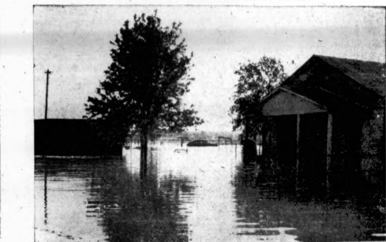
Patvinus Arkansas upi, Tulsoj, Okla., užlieta daug vietovių su gyvenamais namais.

skirtas mamytei, Aušra Vedekaitė savo įprastą "Kur bakūžė samanota" ir vieną itališką, St. Raudonis "Močiute, šrdele" ir "Oi kas".