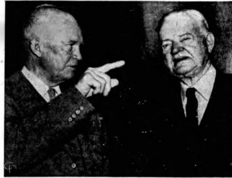
Prez. Eisenhoweris ir buvęs prez. Hoover kalbasi kaip sutaupyti 5 mil. dolerių, sumažinant valdžios aparato išlaidas.