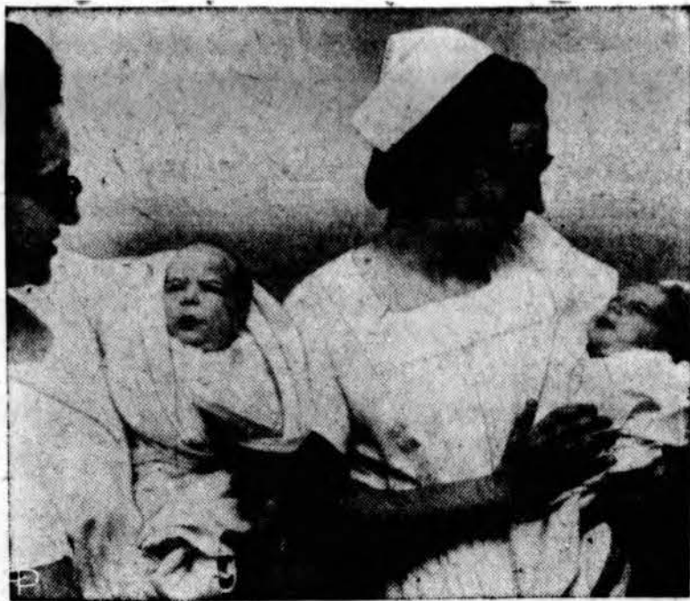
Siamo dvyniai berniukai perskirti sėkmingai operacija North Side ligoninėje Youngstown, O.