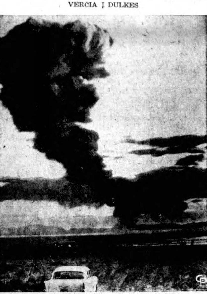
Grybo pavidalo dūmų kamuolis rodo, kaip po dviejų metų tylos vėl buvo išsprogdinta atominė bomba. Sprogimas buvo gegužės 28 d. Nevadoj.