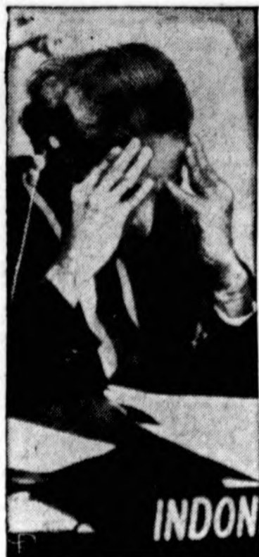
Indijos V. K. Krishna Menon grįžo pirmą kartą į Jungtines Tautas po širdies smūgio, kuris buvo prieš kelis mėnesius. Krishna Menon dabar yra Indijos užsienio reikalų ministras.

Oro biuras praneša: Chicagoje ir jos apylinkėse šiandien — dalinai apsiniaukę, šilta ir galiamas lietus.