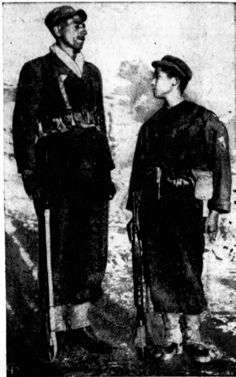
Tėvas ir sūnus yra Alžirijos sukilėlių sąjūdžio nariai. Sukilėliai nori nepriklausomos Alžirijos ir kovoja prieš prancūzų režimą.

Su sėklomis irgi kuriozai. Minėta S. Nėries kolchoze net agronomė nežino, ar sėjamosios avižos yra "kondicinės", patikrintos, ar ne. Anot "Tiesos", ji pasisakė: "Tiksliai nežinau. Jau prieš dvi savaites pristatėm pavyzdžius į sėklų kontrolės laboratoriją, bet duomenų iš jos negauname. Laukėm, laukėm ir nutarėm sėti. Juk ilgiau laukti negalima". Gi Rokiškio MTS sėklų laboratorija pareiškusi: "Sudygus avižos 75%. Nors, tiesą sakant, reikia, kad daugumas būtų 90%, bet gerai bus ir 75%". O kolchozui tų duomenų dėl to nepranešė, kad, gir-