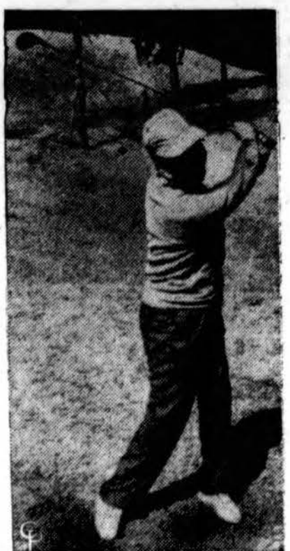
Japonijos ministeris pirmininkas Nobusuke Kishi, prieš išvykdamas į Jungtines Amerikas Valstybes, sužadė golfa Tokio miesto aikštėje. Kishi jau atvyko į JAV ir čia išbuvo dvi savaites.

Aneurin Bevan, britų socialistas, mėgsta kritikuoti valstybės sekretorių Dulles. Jei darbiečiai laimėtų, Bevan turbūt atsisėstų į Britanijos užsienio reikalų ministerio kėdę.