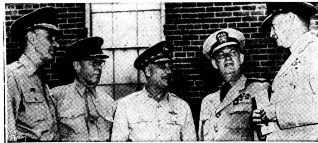
JAV štabo nariai "sekretorių konferencijoje" Marine Corps mokykloje, Quantico, Va. Iš kairės: gen. Maxwell D. Taylor, armijos štabo viršininkas; gen. Randolph Mc-C. Pate, marinų vadas; gen. Nathan Twing, kuris užims adm. Radford vietą, kaip štabo tarybos pirmininkas; adm. Arleigh H. Burke, laivyno operacijų vadas ir gen. Thomas D. White, kuris užims gen. Twining vietą, kaip oro pajėgų štabo viršininkas.