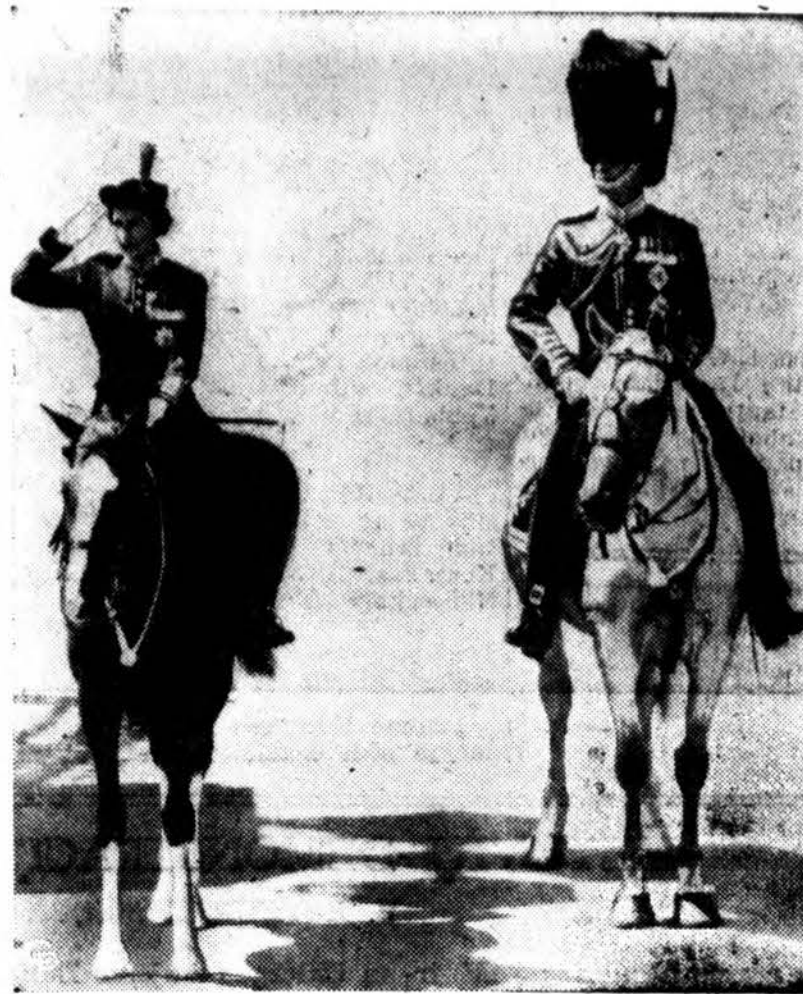
Anglijos karalienė Elzbieta salutuotoja savo gimtadienio sukurtų šventėje. Šalia joja jos vyras Philip. Šiuo metu karalienė yra 31 m. amžiaus. Oficialūs jos gimtadienis yra balandžio 21 d., tačiau tuo laiku karalienė būna išvykusi.

multus, priešingai, valstybė privo labdaros organizacijai padėti.