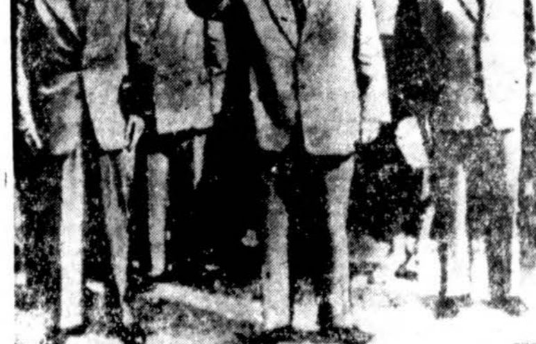
Sovietų politbiuro išvalytojai, išmetę Lietuvos pavergimui va-dovavusį Molotovą ir kitus tris sovietinius didikus, lankosi Čekoslovakijoje. Kairėje matyti Čekoslovakų komunistų sekretorius Novotný, Chruščevas ir Bulganinas.

ROMA, Italija, liepos 11. — Šaltas nuo Alpių atlėkęs vėjas užbaigė Italijoj šilimos bangą, nuo kurios mirė apie 380 asmenų. Per tris valandas temperatūra nukrito nuo 94 l. ligi 73 l.