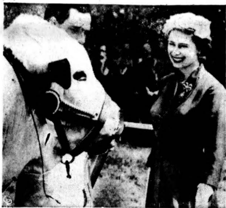
Premijuotas jautis sutinka besišypsantią karalienę Anglijoje. Šis jautis yra išvesta nauja veislė ir pirmą kartą parodomas viešai parodoje.

— Egiptas uždraudė "rock a' roll" — dainas ir filmus, o laikraščiam įsakyta apie jį visai neminėti.