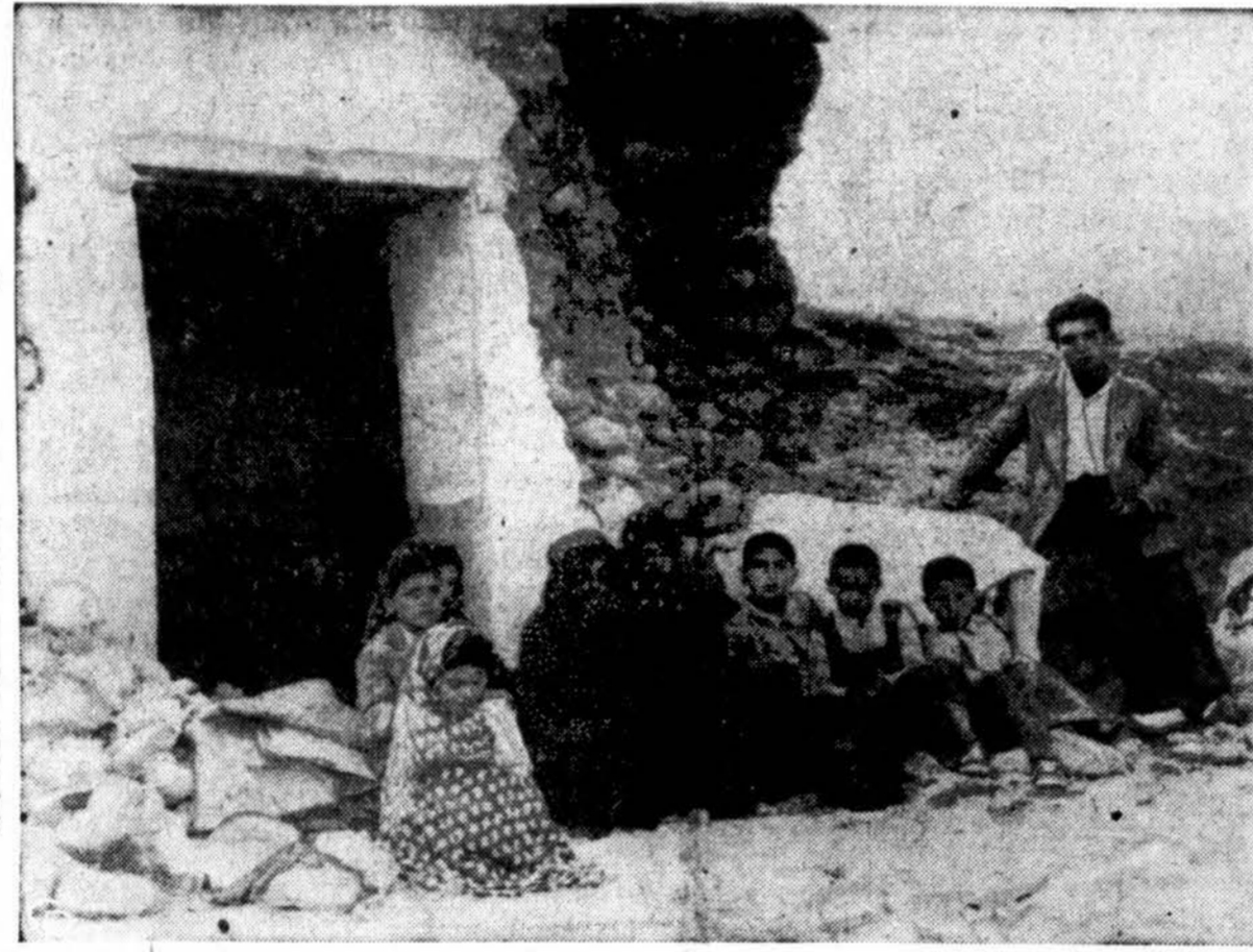
Tai viena iš žemės drebėjime Irane nukentėjusių šeimų. Buvo užmušta 500 žmonių, sužeista apie 5.000. Sakoma, apie 5.000 vaikų gresia mirtis nuo po ištikusios nelaimės prasidėjusio bado. Detrote taip pat, kad šis keleivinis autobusas tapo gerokai apsemtas.

Chicago ir apylinkėse temperatūra apie 80 l. Reikia laukti perkūnijos.