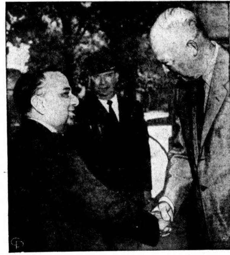
Prezidentas Eisenhoweris sveikina Pakistano ministrą pirmąkart Huseyn Shaheed Suhrawardy Baltuosiuose Rūmose. Pakistano ministras pirmąkart atvyko į Washingtoną prašyti daugiau pagalbos Bagdado paktą vystydamas.

Kaip Augštasis Komisaratas Pabėgėlių reikalams dabar numato, apie tryliką tūkst. pabėgėlių iš to trisdešimt tūkst. skaičiaus, kuris liks stovyklose 1958 m. pabaigoje, galės pasiūlyti JAV vadinamos Escaptee Program, jei dar ir toliau bus paliktas tas pats tai pagalbai gauti tinkamomis priemonėmis. Apie keturis tūkst. pabėgėlių, Komisarato manymu, galėtų įsi-