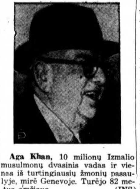
Aga Khan, 10 milijonų Izmalio musulmonų dvasinis vadovas ir vienas iš turtingiausių žmonių pasaulyje, mirė Genevoje. Turėjo 82 metus amžiaus.