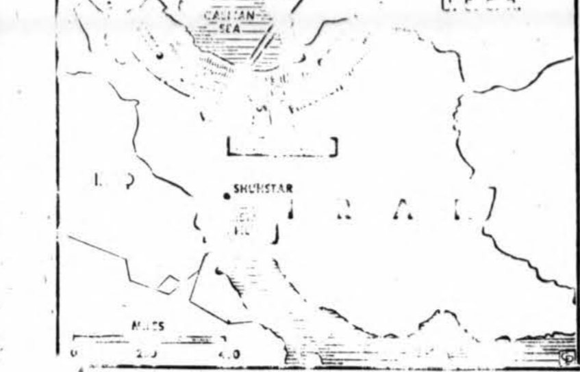
Žemės drebėjimas, kuris apėmė 500 mylių ilgio ruožą, sunaikino apie 120 miestelių ir kaimų Irane. Manoma, jog žuvo apie 200 ir tūkstančiai sužeistų.