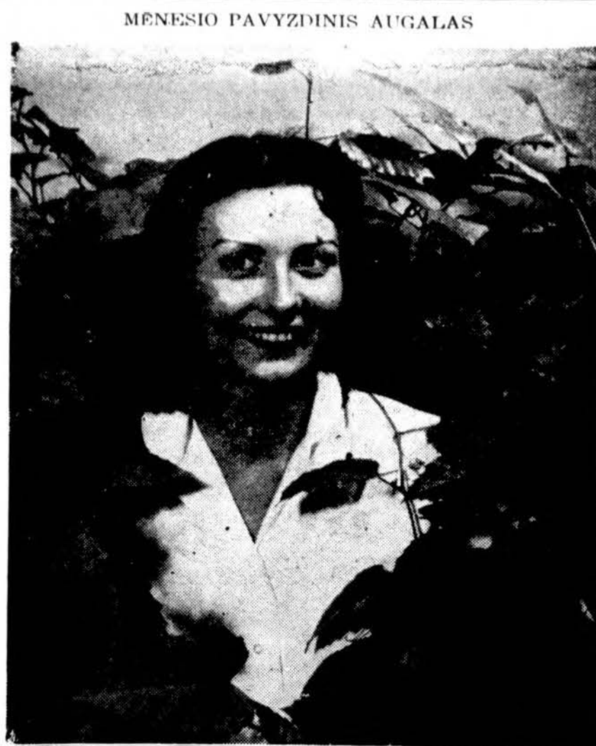
Kangaroo vynmedis (Cissus antarctica) išrinktas šio mėn. pavyzdiniu augalu Lincoln parko gėlynuose. Gėlynai atidaryti nuo 9-5 val.

× Dėmesio! Nuo liepos 1 d. paštas pabrangino: Special Delivery — nuo 20 centų iki 30 centų ir Registered — nuo 30 centų iki 50 centų.