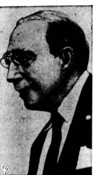
Sen. Theodore F. Green (D. R.I.), 89 metų, JAV senato dekanas, susirgo Pakistano premjero Huseyio Shaheed Suhawardy priėmimo Pakistano ambasadoje, Washingtono. Senatorius nuvežtas į laivyno medicinos centrą Bethesdaje, Md.

Izraelis, žinoma, galėtų tik džiaugtis šiuo sumanymu. Jų