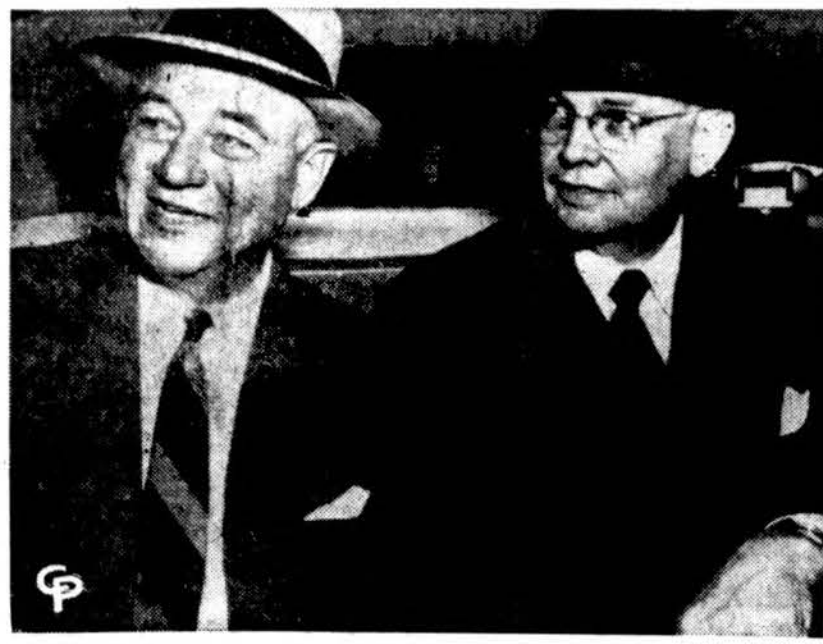
Atsistatydinęs JAV izdo sekretorius George M. Humphrey (kairėje) ir jo įpėdinis Robert Anderson važiuoja iš Baltųjų Rūmų, kur jie tarėsi su prezidentu Eisenhoweriu.