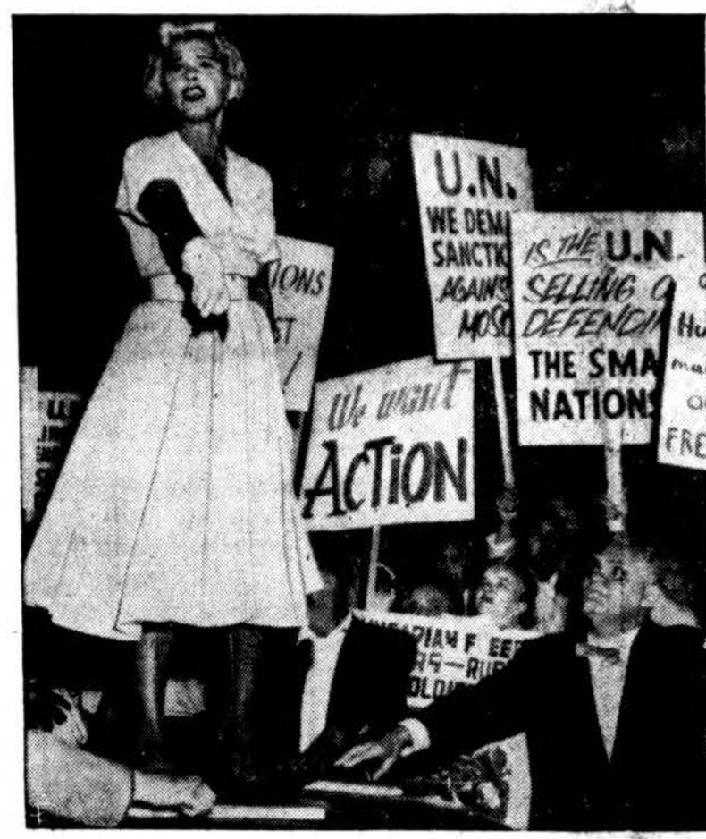
Vengrijoje gimusi Ilona Massey stovi basa ant automobilio prieš Sovietų Sąjungos konsulatą New Yorke ir protestuoja prieš vengrų deportacijas į Rusiją. Ji vadovavo piketininkams prie Sovietų konsulato.