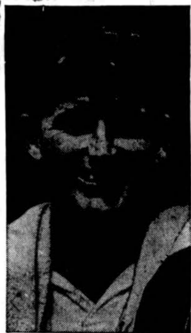
Australietis L. Hoad, laimėjo Wimbledone, Anglijoje, teniso turnyren. Pranešama, jog jis netrukus pasirodys ir JAV.

Šiemet buvo suorganizuotas didelis ir gana įspūdingas paradas, kuriame dalyvavo keli legionierių postai su savo orkestrais. Taip pat dalyvavo JAV armijos ir laivyno orkestrai. Drauge maršavo ir lietuvių skautų vienetai. Paradas prasidėjo prie Western Avenue ir 69 gt. ir baigėsi prie Dariaus ir Girėno paminklo Marquette Parke.