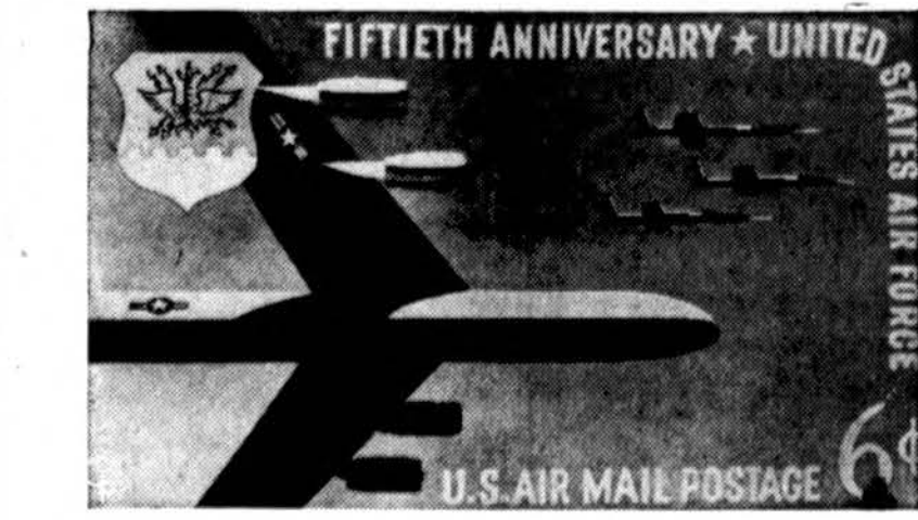
Naujas šešių centų oro pašto ženklas paminėti oro pajėgų 50 metų sukaktį.