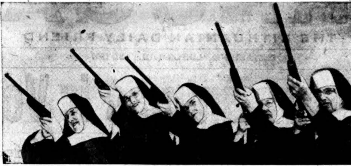
Dievo Apvaizdos seserys vasaros stovykloje Kingston, Mass., susipažįsta su atsistais sautuvais, kurie bus panaudoti berniukų karinam lavinimui.