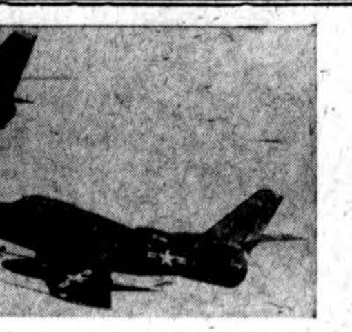
F - 84F Thunderstreak, bombonešis (viršuje), teikia kurą alkanam RF - 84S Thunderflash. Naujoje sistemoje lėktuvas gali įpliti gazoliną kitam lėktuvui greitai skrendant ir 30,000 pėdų augtumoje. (INS)

MASKVA. — „Pravda“ JAV prezidento Eisenhowerio telega-mas visdėlo įdeda į pirmąjį pus-lapį; pvz. nr. 195 taip idėjo Ei-senhowerio padėką už sveikini-mą Amerikos šventės proga. Te-legrama išspausdinta šalia Zuko-vo rašto - įsakymo ryšium su so-vietų laivyno švente. „Izvestijų“ nr. 166 netgi tą patį Eisenho-erio tekstą idėjo viršum minėtojo Zukovo įsakymo.