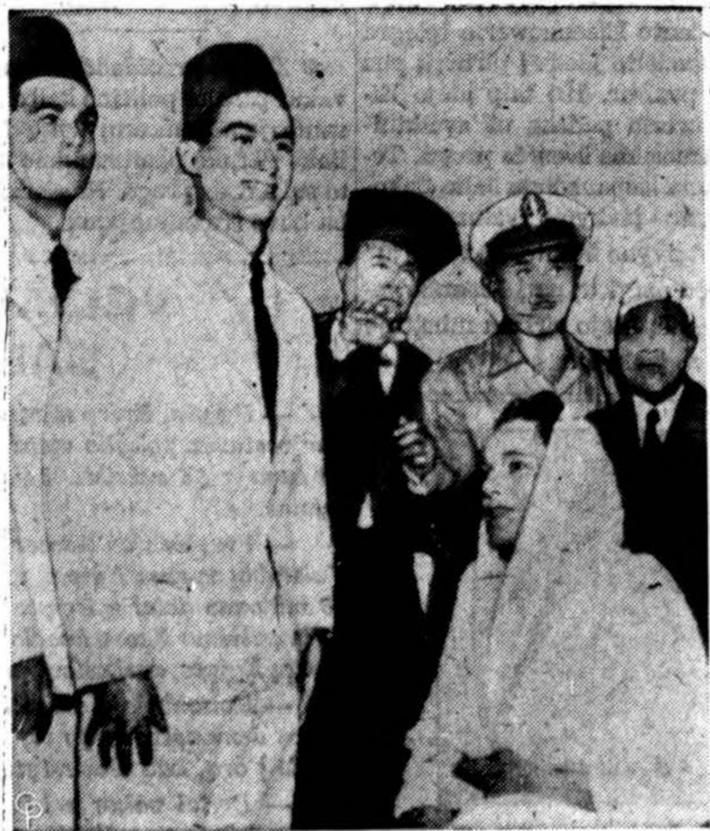
Pirmasis jaunikaitis princas Karim yra įpėdinis mirusio Aga Khano; sėdinti moteris yra princas motina ir mirusio žmona.