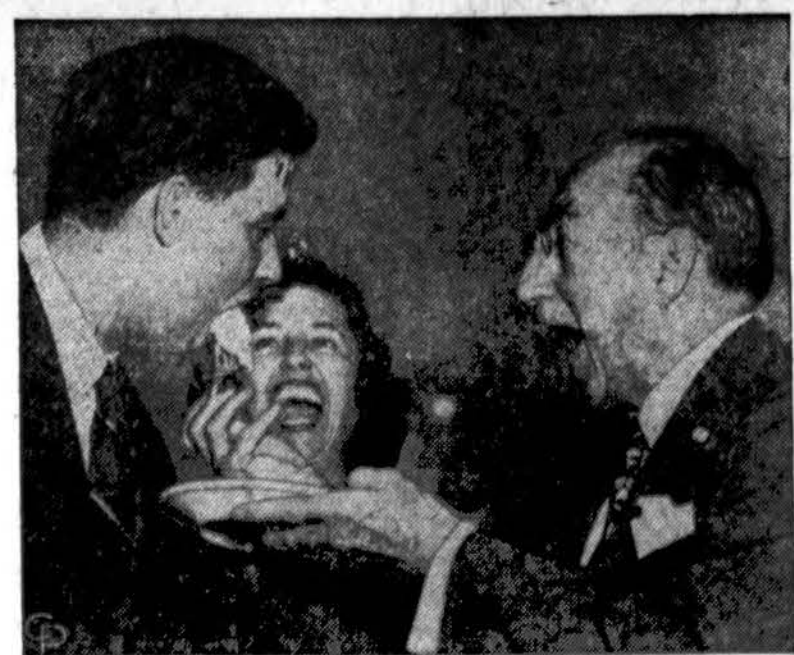
Jauniausias ir seniausias senatoriai dalinasi gimtadienio tortu Washingtono. Frank Church, demokratas (Idaho) šventia 33 m. sukaktį. Jį vaisinga senatorius Theodore Green, demokratas (Rhode Island), kuris turi 89 m. amžiaus. Valdes stebi Church žmona.

● Notre Dame universitetą baigė šį pavasarį 250 asmenų.