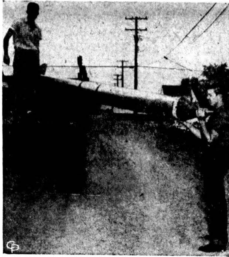
Sie du septyniolikamečiai jaunuoliai per tris metus ir įdėję per tūkstantį dolerių pagamino patys šią raketą, kurią JAV oro pajėgos žada išbandyti.

žmogų, vokiečių visuomenės vadinamą Onkelį - dėdę Heusą, taip pat protestantą.