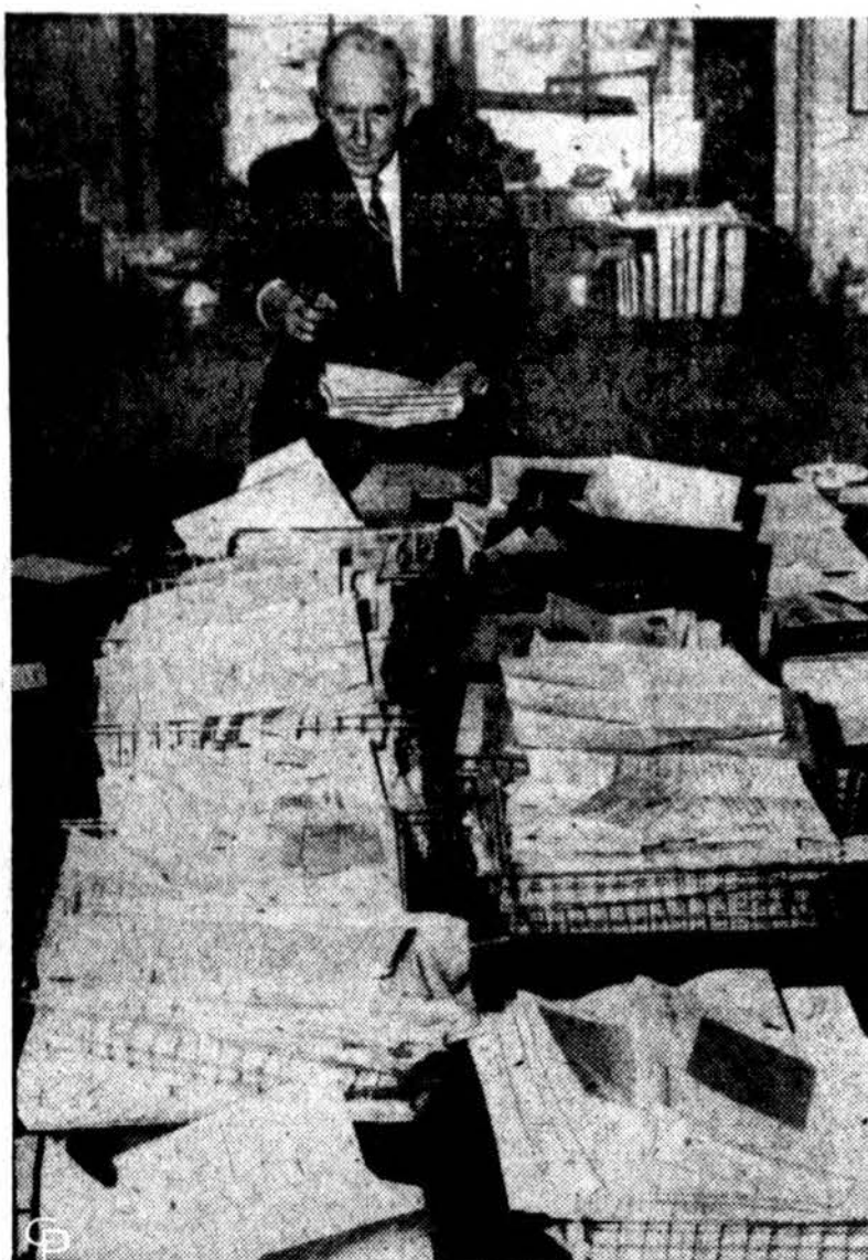
Senatorius B. Russell, pietiečių kovotojų prieš civilinių teisių įstatymą pirmininkas, rodo, kiek jis gavo laišku šiais reikalais.