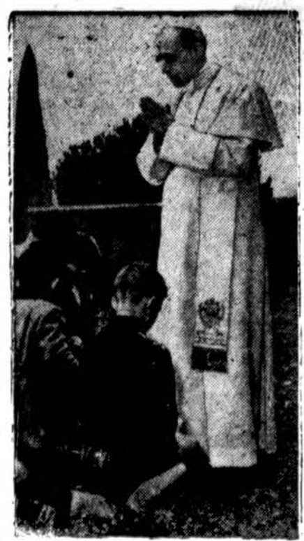
Pope Pius XII vasaros rezidencijoje priima mažus piligrimus.

Chicagoje ir apylinkėse malonus oras. Temperatūra apie 80 l.