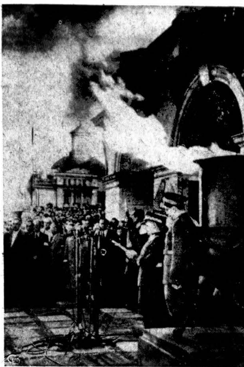
Iškilmės prie Lenkijos nežinomojo Kareivio kapo Varšuvoje. Lenkijos komunistinė vyriausybė leido pirmą kartą viešai prisiminti II Pasaulinio karo aukas.

Pasiūlymas Tad, šioje vietoje, šio rašinio autorius, grynai savo iniciaty-