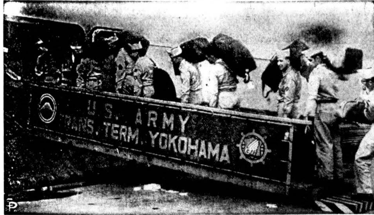
Amerikos kariuomenės personalas lipa į transportinį laivą "General Anderson", kuris išplaukia iš Japonijos su 1512 keleiviu.

Minėtos šventės programa bus pradėta lygiai 6 val. vak.