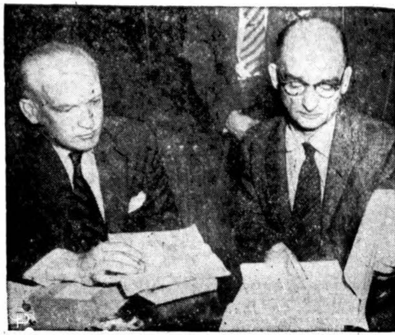
Advokatas James B. Donovan (kairėje) tariasi su pašauktu į teismą savo klientu pulk. Rudolfu Abeliu Brooklyn federaliame teisme. Abelis, kaip žinoma, yra kaltinamas šnipinėjimu Rusijai.