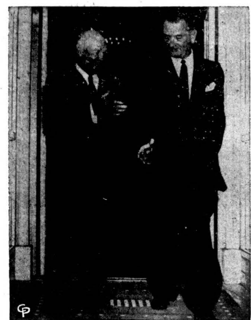
Prezidentas Eisenhoweris atsiveikina su senato daugumos vadu Lyndon Johnson (D., Tex.) prie Baltųjų rūmų durų. Prezidentas Eisenhoweris tarėsi su Johnsonu užsienio pagalbos, civilinių teisių ir kitais politiniais klausimais.

— Du Čekoslovakijos vyrai vakar lėktuvu pabėgo iš Čekoslovakijos ir nusileido netoli Mistelbach, šiaurės rytų Austrijoje. Jie prašė Austrijos pareigūnų tremtinio teisių (azilio).