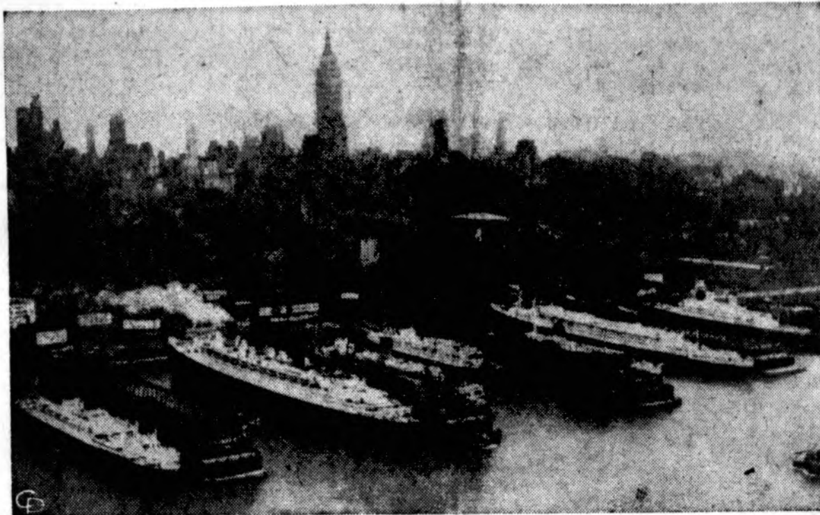
Į New York uostą tą pačią dieną atvyko 9,300 keleivių, daugiausia transatlantinių, dešimtimi laivų. Vasarotojai grįžta namo. Septyni laivai motosi uoste (iš kairės): Britanic, Queen Mary, Mauretania, Flandre, Olympia, United States ir Independence.

Oro biuras praneša: Chicagoje ir jos apylinkėse šiandien — šilta, galimas lietus.