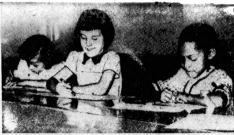
Baltieji ir juodieji I skyriaus mokiniai Nashville, Tenn., Fehr mokykloje.