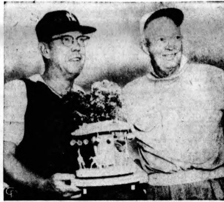
JAV prezidentūros spaudos sekretorius James Hagerty laiko muzikinę karuselę, dovanotą Baltųjų Rūmų fotografo jam ir prezidentui Eisenwoeriui, šiuo metu atostogaujantiems Newport, R.I. Sekretoriaus Hagerty vyresnysis sūnus ir žmona susilaukė kūdikio. Ta proga buvo įteikta ir minimoji dovana.

Didelį krikščioniškojo auklėjimo darbą atlieka katalikiškoji spauda 1950 m. 40% Vokietijos katalikų skaitė savo vyskupijų laikraščius. Viena katalikiškojo laikraščio prenumerata tenka 3.5 katalikams. Tarp populiarių šeimoms skirtų laikraščių pažymėtini šie: "Die christliche Familie (Krikščioniškoji šeima), leidžiama Essene — 200 egz.; "Frau und Mutter" Duesseldorfe — 500,000, "Mann in der Zeit" Augsburgs — 336,000. Jaunimas taip pat turi gausią, gražiai leidžiamą spaudą — įvairius laikraščius ir žurnalus: