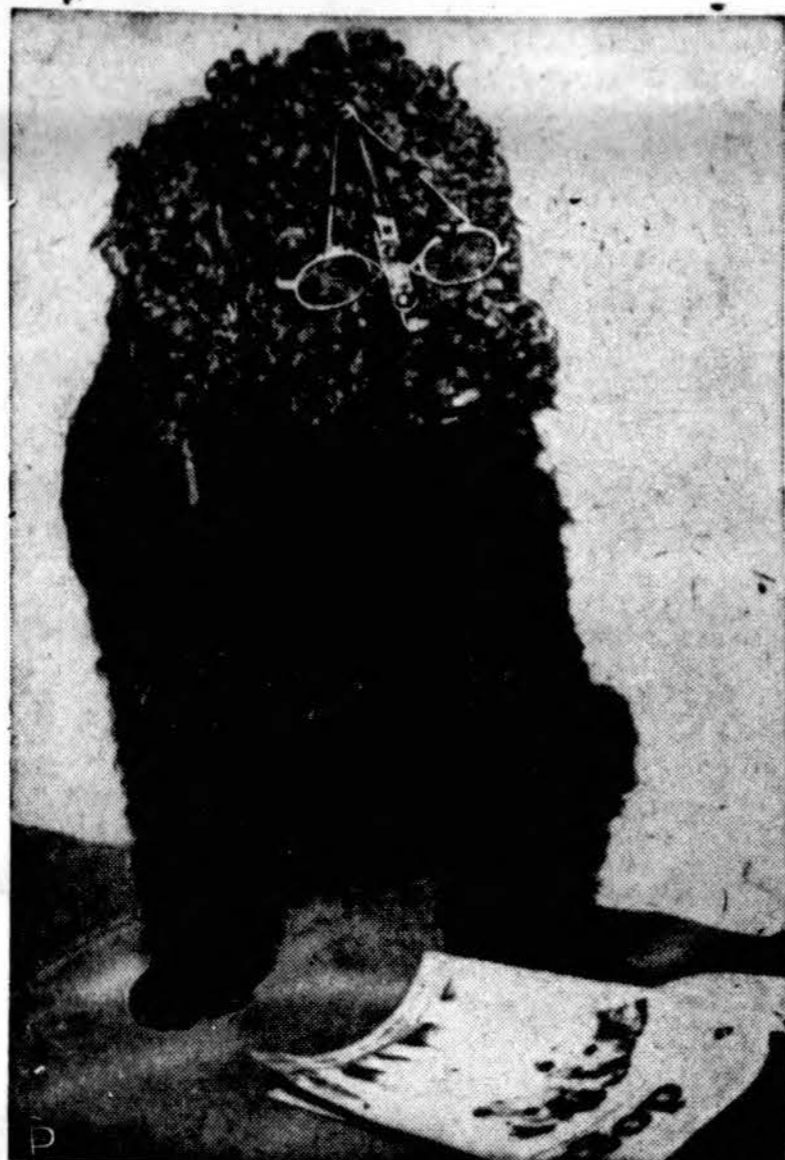
Smoky, 6 m. amžiaus prancūzų veislės šunelis (Chicagoje), dabar jau, pritaikius jam akinius, galės matyti.

gyvenantį 1327 S. 49 Ave., Cicero 50, Ill. Čia bus galima gauti tikrų žinių apie savą giminaučius Lietuvoje.