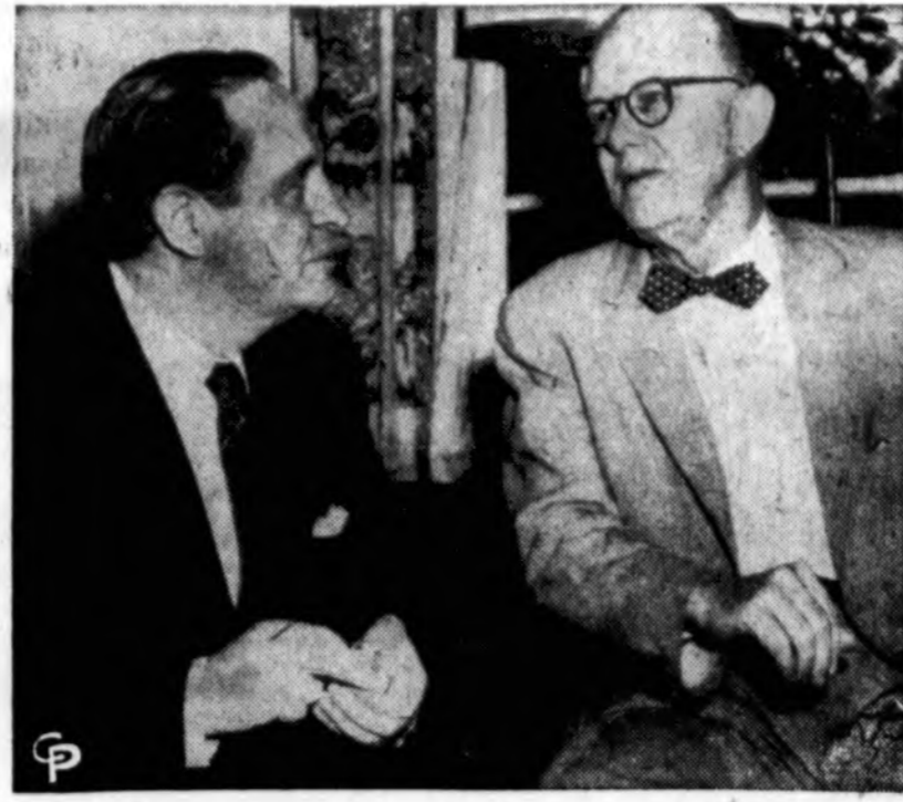
Arkansas gubernatorius Orvil Faubus tariasi su kongreso nariu Brooks Hays dabar iškilusiais rasiniais reikalais Little Rock, Ark.

LEGULO, Department D. 5618 W. Eddy St., Chicago 34, Ill.