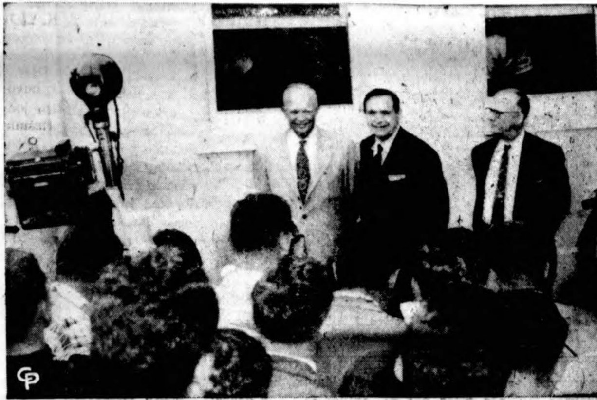
Prezidentas Eisenhoweris, gubernatorius ir kongreso narys Brooks Hays kalba spaudos atstovams po konferencijos mokinių integracijos klausimais Arkansaso valstybėje. Šis pasitarimas įvyko vasaros Baltuosiuose Rūmuose Newport, R.I.

Dar griežčiau prieš Faubus taktiką pasisako "The Advocate". Jis gubernatoriui žingsnių laiko daugiau, negu klaida. Tai esąs ligūstas pavartojimas jėgos ten, kur jos visai nereikia. Laikraštis primena gubernatoriui, kad jis yra prisiekęs laikytis