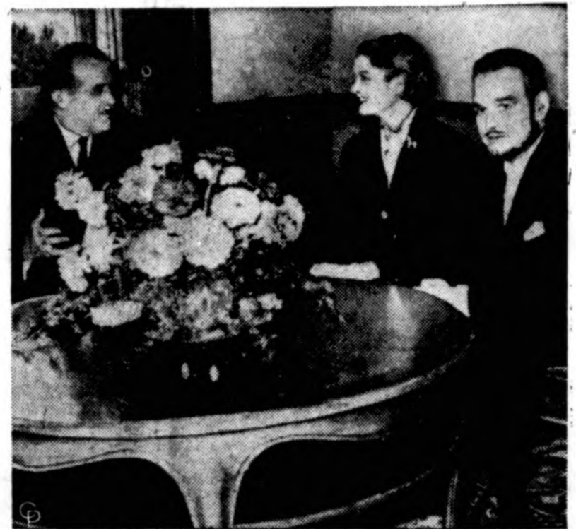
Monako princas Rainier ir jo žmona princesė Grace (Kelly) kalbasi Šveicarijos užsienio reikalų ministru Max Petitpierre (kairėje), kuris juos priėmė valstybės rūmuose Berne.

Didelė Japonijos atsiginklavimo reikšmė Kad Japonijos atsiginklavimas yra rimtas ir reikšmingas, tai jau matyti iš to fakto, kad Sovietų Sąjunga daug karo laivų iš Baltijos ir Juodosios jūrų perkėlė į Rytų Aziją ir taip pat neatitiktinai rusai neseniai užblokavo Vladivostoką nuo svetimų laivų. Rusų bolševikai žino, kad Japonija yra rimta pajėga karo atveju.