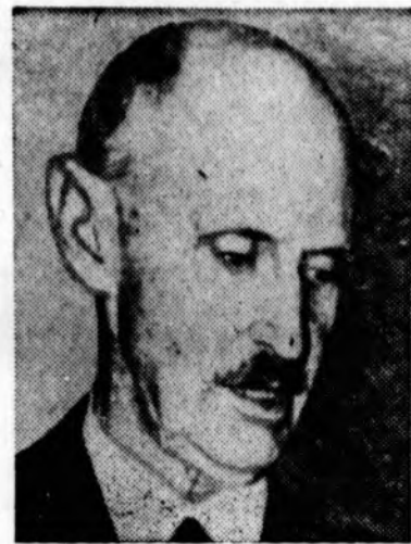
Norvegijos karalius Haakon, 85 metų amžiaus, mirė. (INS)