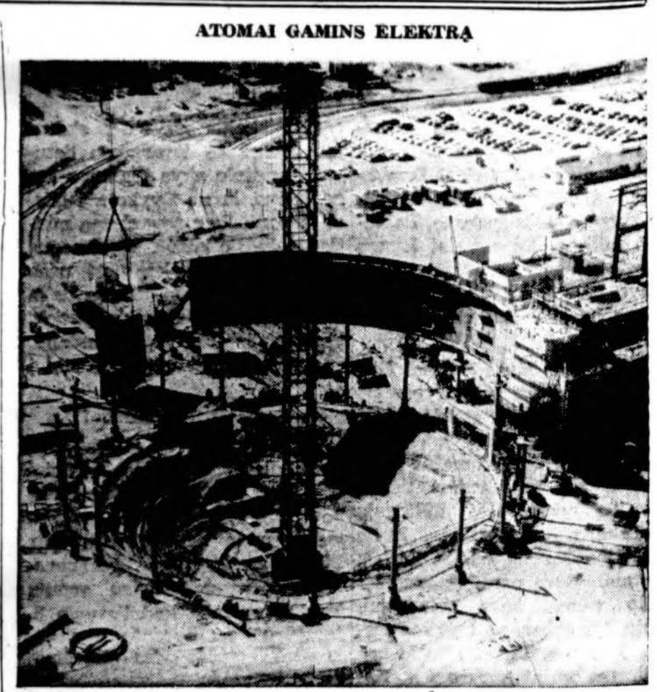
Commonwealth Edison kompanija Chicagos apylinkėje stato elektros gamimo stotį Dresden mieste, 50 mylių nuo Chicagos. Čia matosi atomo gamimo stoties valdas; stotis kainuos 45 milijonus dolerių ir bus užbaigta 1960 metais (Skelb.)

Prasidėjus emigracijai, pabėgėliai būžinojo, kad už tai jie labiausiai turi būti dėkingi Ame-