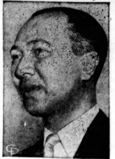
Pote Sarasin, naujas laikinis Tailando ministras pirmininkas. Jis yra ir Pietryčių Azijos valstybių organizacijos generalinis sekretorius. Sarasin, 52 metų yra buvęs ambasadorius Jungtinės Amerikos Valstybėms.

Jei ankstesniais metais jaunimas, baigęs vidurines mokyklas, netiesiogiai buvo raginamas jungtis į fizinį darbą, ypač vykti į kolchozus, tai nuo šių mokslo metų pradžios tiek Lietuvoje, tiek visoj Sovietų Sąjungoje yra įvesta privaloma „gamybinė praktika“ vidurines mokyklas baigusiais ir norintiems toliau studijuoti. Tikrovėje tai nėra tik rąja žodžio prasme kokias nors praktika. Tai yra bolševikų priemonė priversti jaunimą prieš studijas bent du - tris metus dirbti, ypač kolchozuose, kuriuose vis ryškiau jaučiama darbo rankų stoka, kadangi dėl sunkių sąlygų dažnas jaunuolis deda pastangų išsiveržti iš šito bolševikinio darbo baudžiavos. Šiais metais Lietuvoje baigusieji vidurines mokyklas jau ir norį studijuoti negalėjo. Pirmiausia jiems teko įsi-