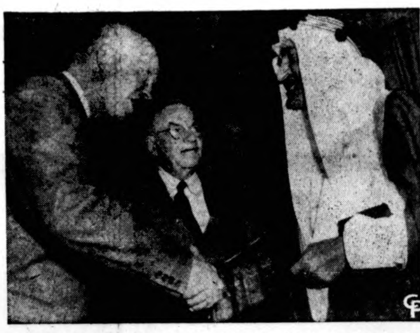
Prezidentas Eisenhoweris sveikina Saudi Arabijos princą Faisalą Baltuose Rumuose. Prezidentas Eisenhoweris tarėsi su Saudi Arabijos princu Artimųjų Rytų politikos klausimais. Valstybės sekretorius John Foster Dulles (viduryje) taip pat dalyvavo konferencijoje.

VILNIUS, okup. Lietuva. — Vilniaus radijas informuoja, jog šių metų mokslo metų pradžioje į Vilniaus universitetą, bolševikų pavadintą Vinco Kapusku vardo universitetu, įstojo apie 700 naujų studentų. Daugiau kaip pusė jų apgyvendinti studentų bendrabučiuose. Stipendijas gauna 82 proc. visų studentų.