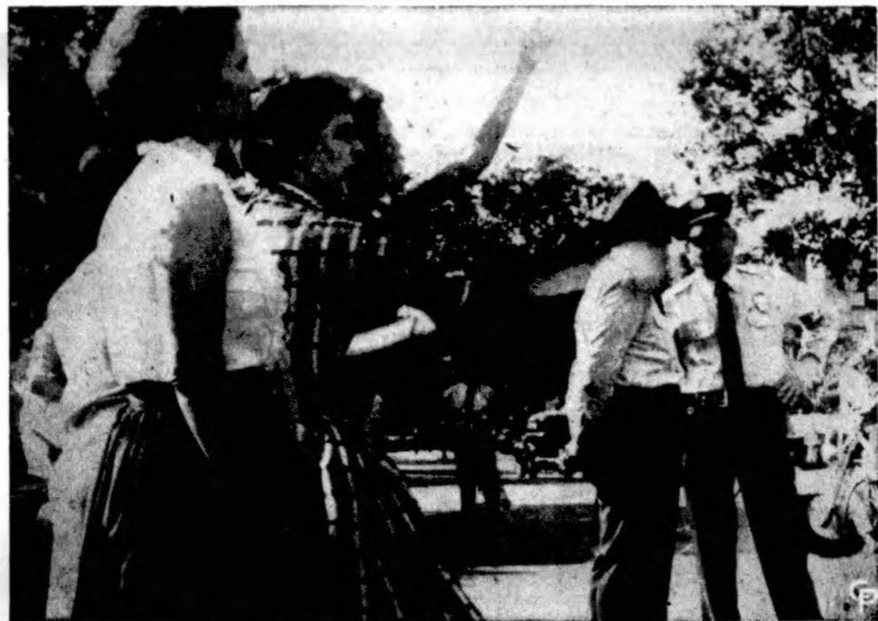
Mergaitės studentės paliko augštesniosios mokyklos klases Little Rock miestelyje, kai į mokyklą atėjo aštuoni juodi mokiniai. Keli šimtai iš 2,000 studentų vaikščiojo gatvė prieš mokyklą demonstruodami.