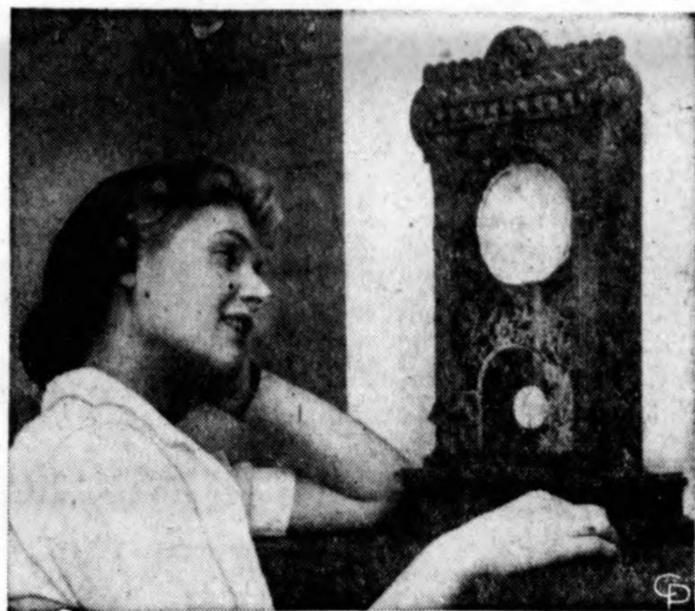
Nors netrukus reikēs atsukti laikrodžius, tačiau šio laikrodžio sukči nereikēs, nes nerodo valandų, o tik skaičiuoja padarytą darbą. Jis yra pagamintas T. A. Edison laboratorijoj Fort Myers, Fla.