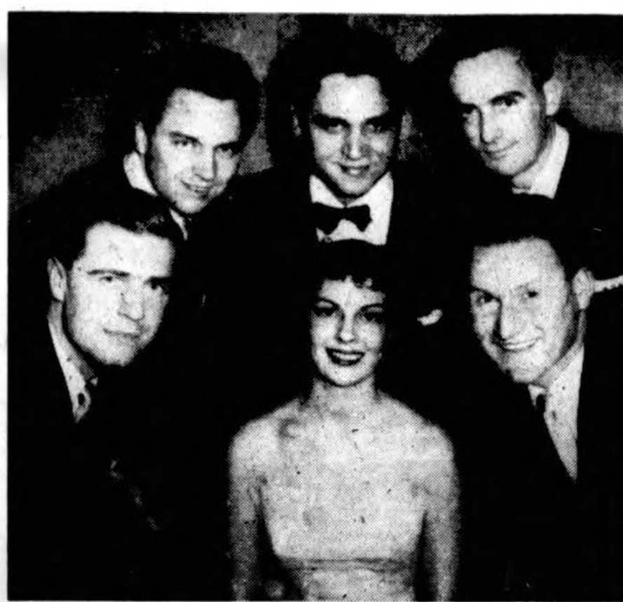
Toronto Vyrų kvartetas, kuris išpildys programą Hamiltono at-ku ruošiamame spaudoje baliuje š. m. spalio 12 d. Connaught Royal viešbutyje.