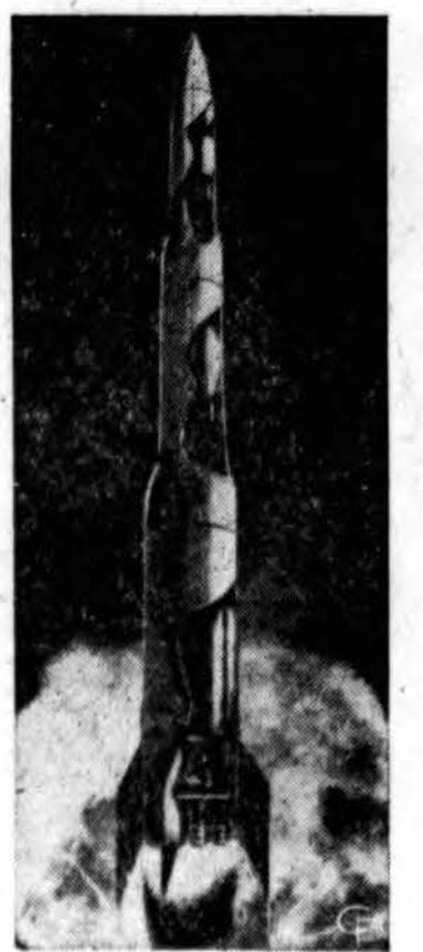
Daugelio dalių JAV raketos motoras, skayačiu varomas, teoretiskai galėtų nukristi į Marsą ir Veną. (INS)