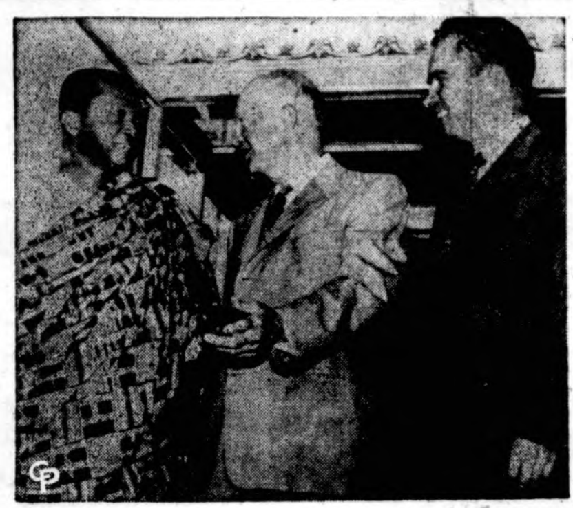
Prezidentas Eisenhoweris kalbasi su Ghanos finansų ministru K. A. Gbedemah (kairėje) Baltuose Rūmuose. Kartu su jais Nixonas (dešinėje). Prezidentas Eisenhoweris atsispašė finansų ministerį, kad jam nedavė valgyti Delaware restorane, kadangi jis spalvotas.