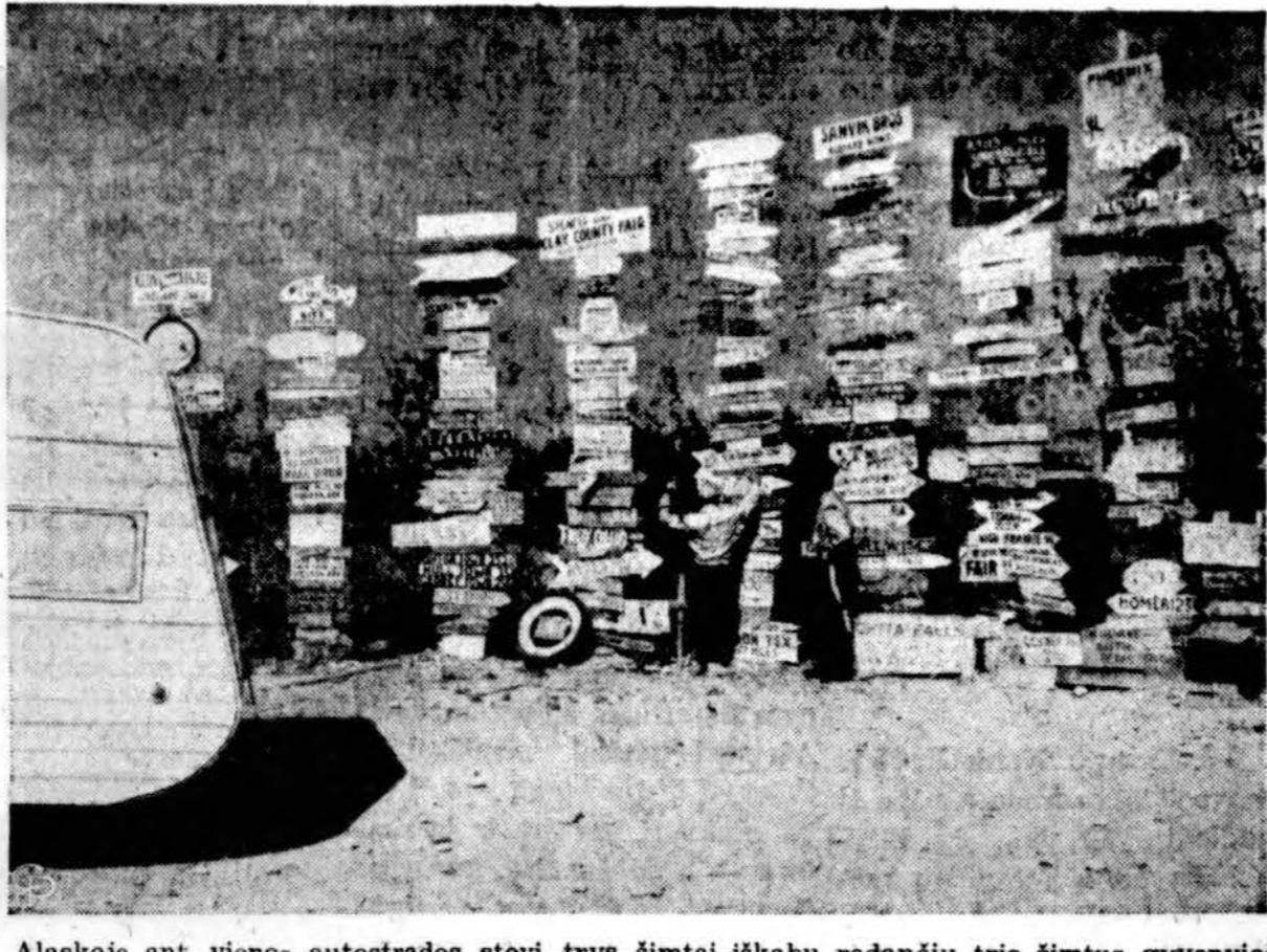
Alaskoje ant vienos autostrados stovi trys šimtai iškabų rodančių tris šimtus gyvenviečių. Autostradą ir iškabas prižiūri Kanados policija. (INS)

ALT centro kvietimas rengti Bostone Amerikos lietuvių kongresą 1958 m. birželio mėn.