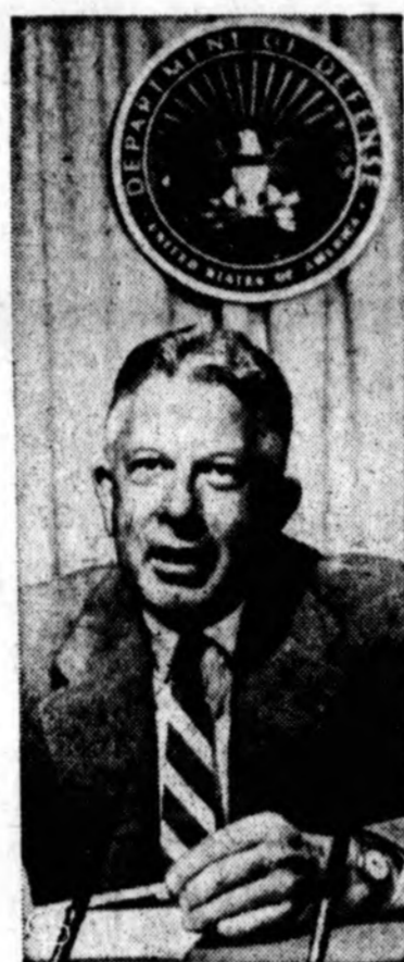
Neil McElroy, nauja JAV apsaugos sekretorius, įstaigoje. Jis paskirtas vieton Charles Wilsono, kuris iš apsaugos sekretoriaus pasitraukė.

Esama įsitikinimo, kad skrendančios raketos orbita mažėja t. y. ji artėja prie žemės. Tačiau niekas negali pasakyti, kada ji nukris. Manoma, kad krisdama ji sudegs, kaip meteoras. Praėjusį sekmadienį stebėtojai galėjo jau iš Amerikos pamatyti skrendančius kūnus.