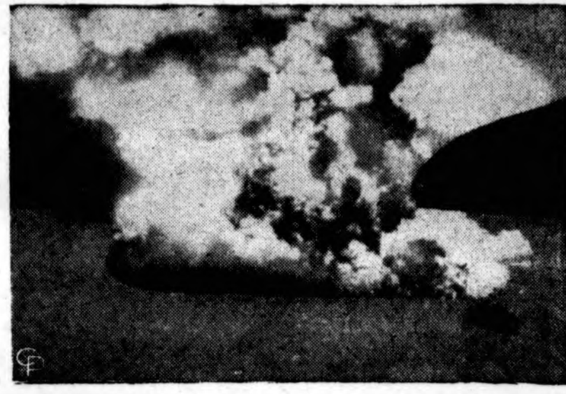
Deganti sala pasirodė prie Azorų. Fotografas kuris šią rūgstančią salą pastebėjo ir nufotografavo teigia, kad ši su ugniakalniu sala yra 500 pėdų diametro. (INS)

Galima gauti "D o AUGO" Administraciją 1545 West 63 Street, Chicago 29, Ill.