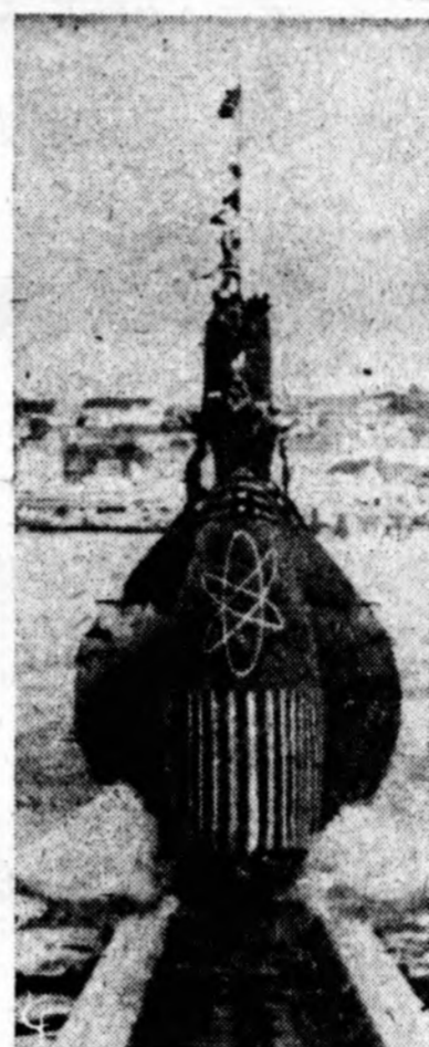
JAV atominis povandeninis laivas Sargo II paleistas į vandenį San Francisco uoste, Calif. Tai penktas Amerikos atominis povandeninis laivas. (NIS)

PRAGA, spal. 14. — Čekoslovakijos komunistinė spauda prisipažįsta, kad komunistų pastangos laimėti jaunimui jaunimą nedavė vaisių. Partijos organas „Rude Pravo“ nusiskundžia, kad didžioji jaunimo dauguma atvirai vengia politinių klausimų ir yra abejinga komunistinei ideologijai. Atrodo, pastebi laikraštis, kad Čekoslovakijos jaunimas ne tik nemėgsta politikos, bet yra net priešingas komunistui. Čekoslovakijos komunistinio jaunimo unija, kuriai priklauso vienas milijonas 250 tūkstančių narių, toliau rašo „Rude Pravo“, yra netekusi savo komunistinio pobūdžio. Daugelis jaunuolių ją laiko tik paprastu formalumu. Komunistinis jaunimo sąjūdis yra reikalingas tam, pabrėžia baigdamas partijos organas, kad būtų galima atsverti šeimos įtaką.