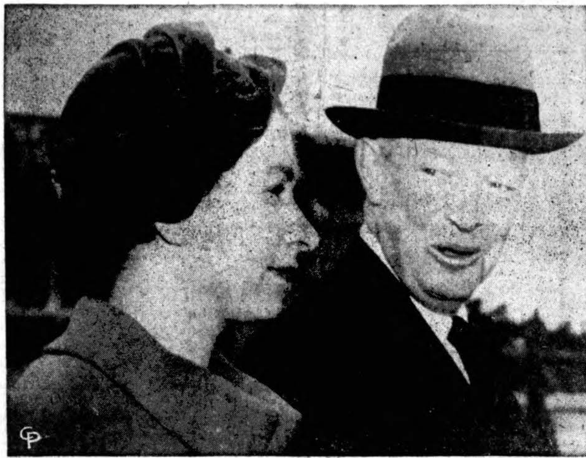
Britanijos karalienė Elzbieta II ir prezidentas Eisenhoweris Washingtono aerodrome. Prezidentas Eisenhoweris užvakar sutiko Washingtono aerodrome karalienę Elzbieta ir jos vyrą princą Pilypą, kurie JAV sostinėje bus keturias dienas. Jie yra Baltųjų rūmų svečiai.

● JAV 6-to laivyno kreiseris Canberra ir trys kiti karo laivai vakar atvyko į Turkijos Izmir uostą.