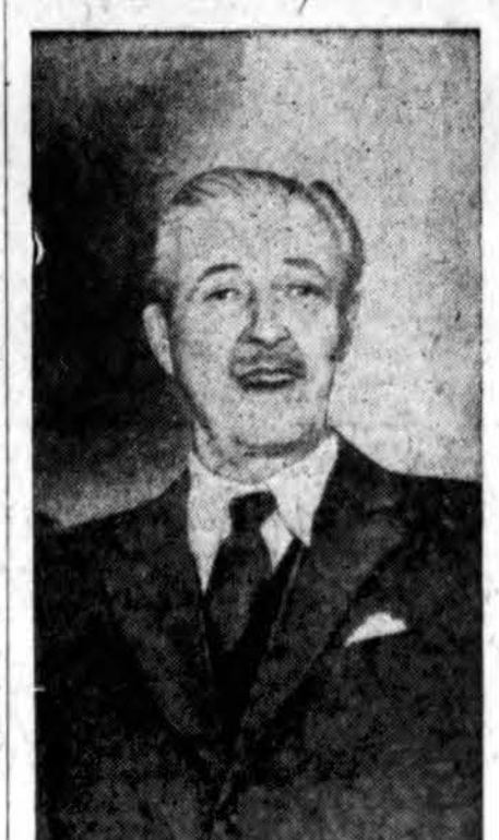
Britanijos premjeras Macmillan sekantį antradienį atskrenda į Washingtoną tartis su prezidentu Eisenhoweriu aktualiais politiniais klausimais.

● Turkija vėl atmetė Sirijos kaltinimus, kad Turkija planuoja agresiją. Turkija apkaltino Siriją, jog ji savo veikloje turi užkulisinių minčių.